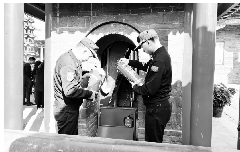
为全面做好消防安全管控工作,维护辖区各类活动安全有序举办,10月23日,石嘴山市消防救援支队深入大武口区北武当生态旅游风景区开展隐患排查和消防宣传,全力预防火灾事故的发生。支队消防监督员重点查看了景区的消防控制室,景区疏散通道、安全出口是否畅通、消防设施和器材、灭火器、消火栓是否完好有效等情况。

活力的“晴雨表”。今年以来,我国邮政快递业持续快速发展,自3月起,单月快递量超百亿件,月均业务收入超900亿元,创历史新高。国家邮政局相关负责人表示,这些发展成绩的取得,离不开供需两方面的共同努力。在需求侧,宏观经济向好的态势极大释放了行业的发展动能,有效带动了行业规模的持续扩大。在供给侧,行业城乡发展更加均衡,设施建设更加完善,在提高国内运输、分拣整体效能的同时,服务网络通达国家和地区数量进一步增加,有效夯实了行业发展基础。(据《工人日报》)