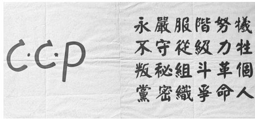
▲在水口镇叶家祠发展新党员时使用的入党誓词。

1927年9月，秋收起义爆发，在攻打长沙的计划难以实现的情况下，毛泽东果断决策南下罗霄山脉，途中脚部受伤，他仍坚持不用担架，拄着拐杖一瘸一拐行进在队伍里。9月29日，部队到达江西永新三湾村，并在这里进行改编，三湾改编的一项关键内容就是“支部建在连上”。为进一步加强连队的建设，毛泽东多次要求各连党代表加强思想政治工作，在士兵中发展一批工农骨干分子入党。他本人经常利用休息时间，找战士们谈心，对他们进行共产主义信念和革命前途教育，并从中发现、考察、培养了一批先进积极分子，各连党代表也在战士中发现、培养了不少工农出身的积极分子。当部队到达湖南酃县（今炎陵县）水口镇，环境也相对安定了，发展党员的条件逐渐成熟了。