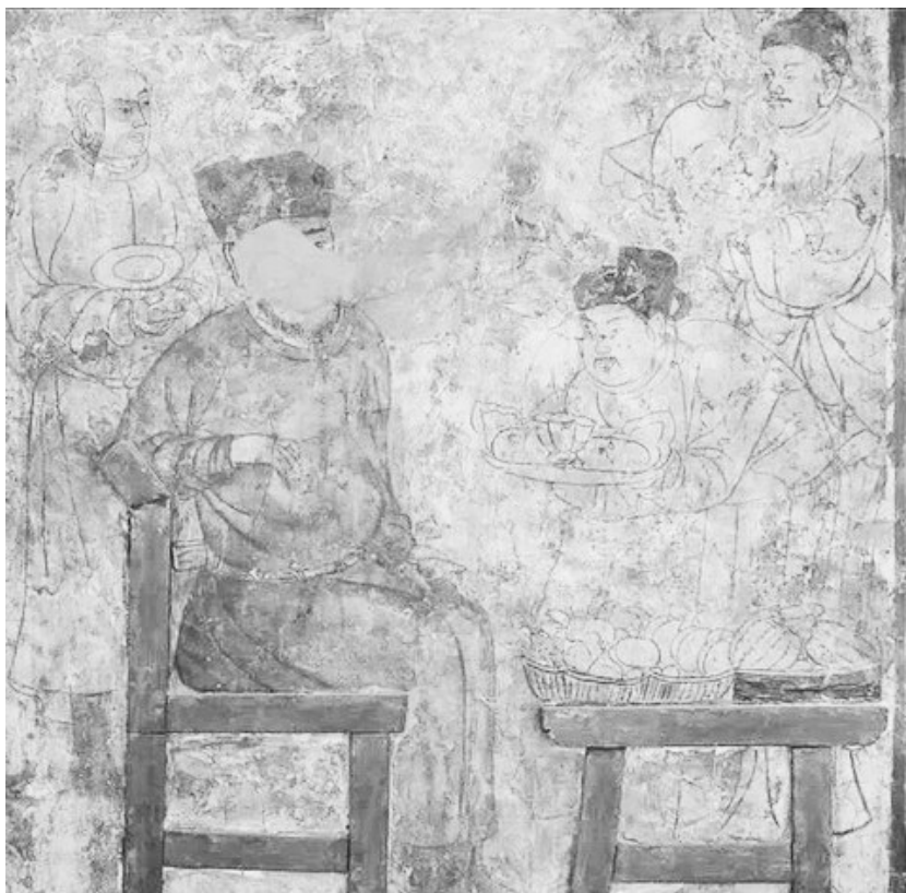
内蒙古古代墓葬壁画上的“西瓜图”。

宋引种西瓜摩崖石刻”就记述了培育西瓜的情况：“咸淳五年（公元1269年），在此试种，种出多产，满郡皆与支送。其味甚佳，种亦遍及乡村。”通过选种实验，西瓜的种植技术逐渐升级，味道更佳，产量更丰。至元代，西瓜栽培技术已经很成熟。元朝初期的《农桑辑要》最早记载了西瓜栽培技术，当时已有重约30斤的巨型西瓜出产。明清时期，种植面积扩大到全国，许多省份都有了自种的西瓜名种。北京南部的大兴地区已经有向皇室进贡的专门瓜园。