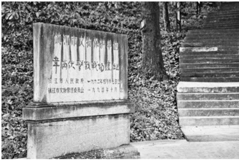
位于江苏省镇江市的新四军韦岗伏击战战场遗址。

然而，在上海、南京、杭州等大中城市和战略要地相继被日军占领，江南地区国民党军队一溃千里，加之当时刚刚改编的新四军部队人员数量少、武器装备差的情况下，国民党军队和当地民众普遍对抗战胜利失去了信心。粟裕经过认真研究后，决定尽快打一场胜仗，以激发江南民众抗日热情、打击日军嚣张气焰、鼓舞部队士气斗志。为确保“第一仗必须打胜，不许打败”，粟裕经过反复研读地图、熟悉地形、侦察敌情，决定将作战地点选在“韦岗”，将伏击时间定在6月17日8时至9时之间。韦岗位于镇江西南15千米，其东、西两侧为小山地，东侧马鞍山高198米，西侧高骊山高455米，镇(江)句(容)公路蜿蜒穿过两山，是日军运输车队必经之处，也是较为理想的伏击地域。