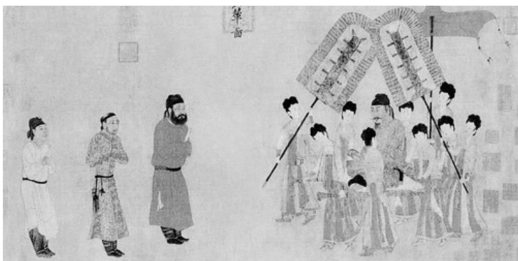
唐 阎立本《步辇图》中的长柄礼仪之扇。

扇风谁都会，可如何扇风在过去是有讲究的。俗话说，文人扇胸，武人扇肚，农民扇背，和尚扇领口，轿夫扇裤裆，青士扇袖筒，可见扇子对于身份不同的人来说，功能是不一样的，这似乎是身份、品位所决定的。之所以这样，除了考虑到要在各自职业特点和穿着打扮的界定下，实现进风量的最大化，还要顾及自己的体面。文人最讲面子，哪怕要热死也只是把一把小扇子扶在胸前，轻轻地扇风，慢慢地摇。而青士则擅长看书，挥毫泼墨之余，用扇子扇一下袖筒，这样就能达到“两袖清风身欲飘”的效果。