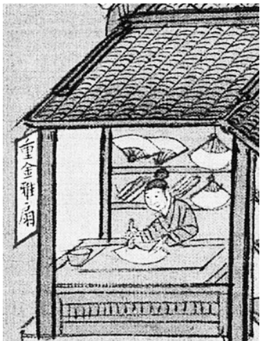
明 仇英《清明上河图》中的制扇铺。

除了这些人物外，扇子也会在宫廷中流传，只不过扇子更为精致、高贵或者扇子更大罢了。在唐代有一种叫作“仪仗扇”的东西，这个在阎立本的《步辇图》中可以看到，这种扇子除了能够显示身份独特外，还能遮挡刺眼的阳光和风尘，尤其在户外时颇为壮观。只不过拿着这些仪仗扇的人很是辛苦，遇到大风就要被吹得前仰后合。不知那时皇帝是否会体谅，叫他们收了扇子。