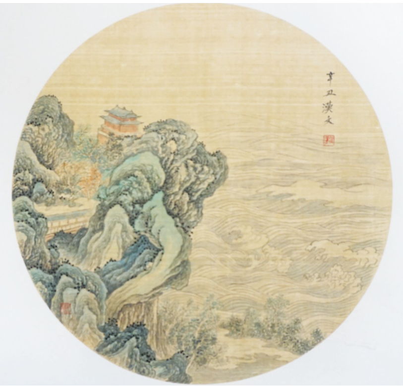
▲《望江图》张汉文 作(农工党宁夏书画院特聘书画家)