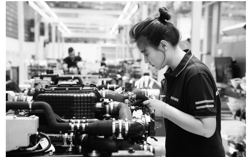
近年来,江苏省常熟市全面落实新发展理念,加快布局氢燃料电池产业,推动产业转型升级,形成了从创新研发到系统集成、示范应用等较为完善的产业链。2022年,常熟氢燃料电池产业规模以上企业实现产值24.6亿元。

中共中央政治局常委、中央办公厅主任蔡奇陪同考察。李干杰及中央和国家机关有关部门负责同志陪同考察,主题教育中央第一指导组负责同志参加汇报会。