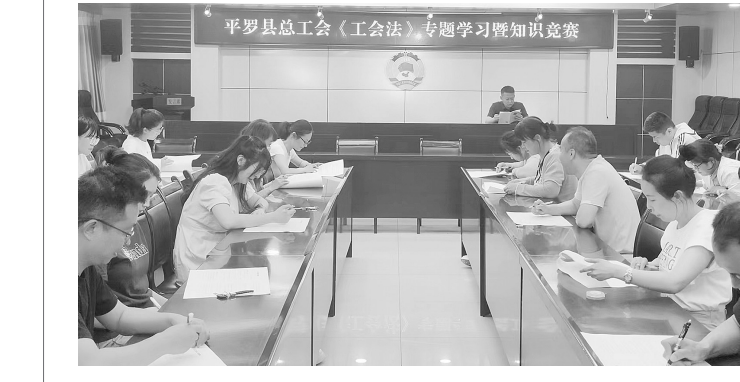
6月7日,石嘴山市平罗县总工会开展2023年《中华人民共和国工会法》专题学习暨知识竞赛活动。

本报(记者 王斌)近日,国网盐池县供电公司结合关键岗位人员廉政谈话与员工违规经商办企业自查自纠活动,深入开展廉洁文化进班所活动。该公司计划将依托道德讲堂,把唱廉、学廉、诵廉、警廉、思廉、诺廉作为重点,紧密结合工作实际,深度开启廉政文化进班所新平台。持续以班所员工的日常工作内容为基础,引导员工牢固树立底线思维、红线意识,不断创新一线班所廉洁文化教育内容和形式,把廉洁文化送到班所,营造风清气正的良好干事环境。