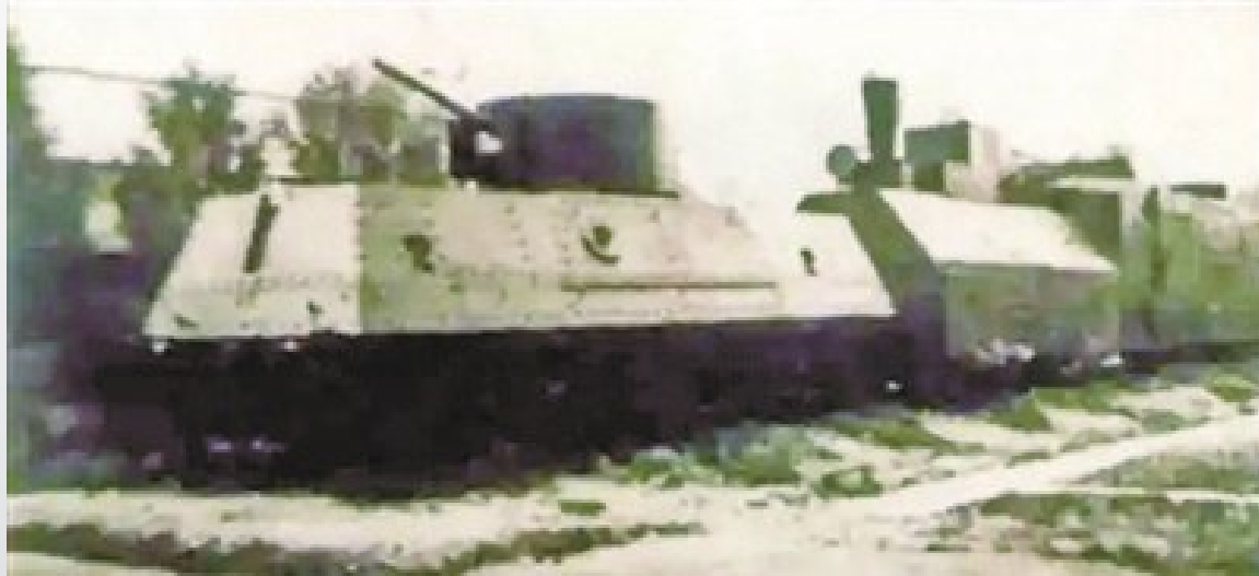
铁甲列车局部外形。

1924年，随着第一次国共合作的实现，广东成为全国革命的中心，工农运动蓬勃发展。军阀、商团的骚扰，让广东革命政权内部危机严重。中共广东区委征得孙中山同意，组建大元帅府铁甲车队。11月中旬，经过改组扩充的大元帅府铁甲车队正式成立，这是第一支由中国共产党直接建设和掌握的武装力量，也是之后被称为“铁军”叶挺独立团的前身。