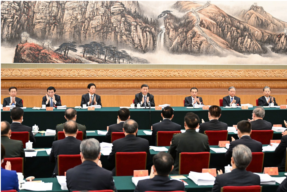
10月18日，中国共产党第二十次全国代表大会主席团在北京人民大会堂举行第二次会议。习近平、李克强、栗战书、汪洋、王沪宁、赵乐际、韩正等出席会议。

新华社北京10月18日电 中国共产党第二十次全国代表大会主席团18日下午在人民大会堂举行第二次会议。习近平同志主持会议。会议通过了将关于十九届中央委员