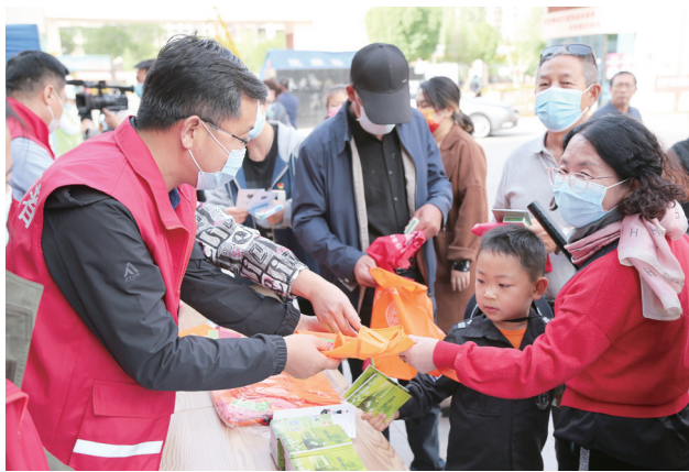
生态环境志愿者向群众宣传节能环保知识。

“推进大气治理项目不仅是企业履行社会责任的体现,也是推动绿色发展的长远举措。项目全部建成后,企