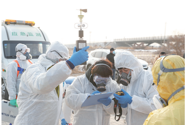
自治区生态环境厅开展水污染环境应急演练。