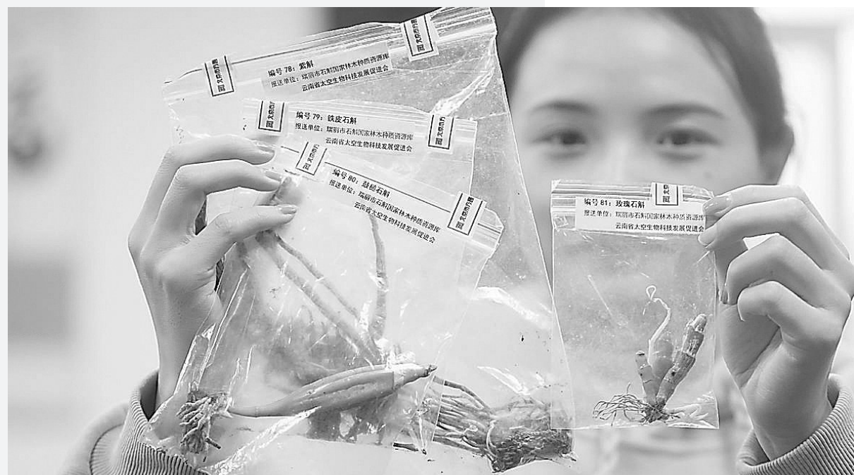
一起归来。经过“太空育种”的石斛种质资源随神舟十二号载人飞船

另一方面,还有一些植物种子被带上天,是希望利用太空各种复杂的环境,提高植物基因变异的可能性,随后再从中培育出新的植物品种。据悉,这已经是一项市场价值可达2千亿元产业。