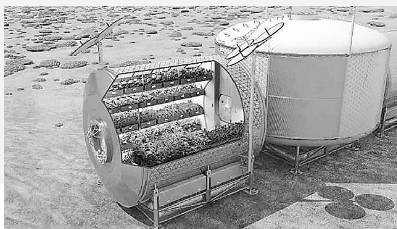
美国航天局计划在火星放置这样的蔬菜箱。

经过不懈努力,太空育种已经在我国粮食安全和生态环境建设等诸多领域作出了重要贡献,诞生超过700多个新品种,通过国审和省审的航天育种新品种超过200个。我国培育的小麦、水稻、玉米、大豆、棉花和番茄、辣椒等园艺作物新品种,累计种植推广面积超过240万公顷,增产粮食约13亿公斤,据推算创造直接经济规模超过2000亿元。