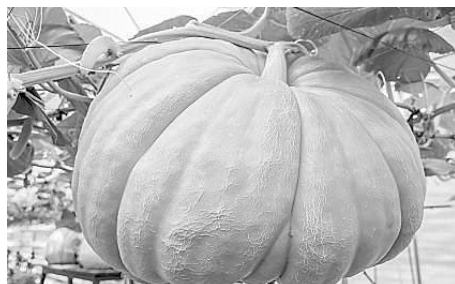
2021年7月19日,甘肃天水国家农业高新技术示范园航天育种基地的果蔬展示厅里,200多斤重的“航天大南瓜”正在生长。