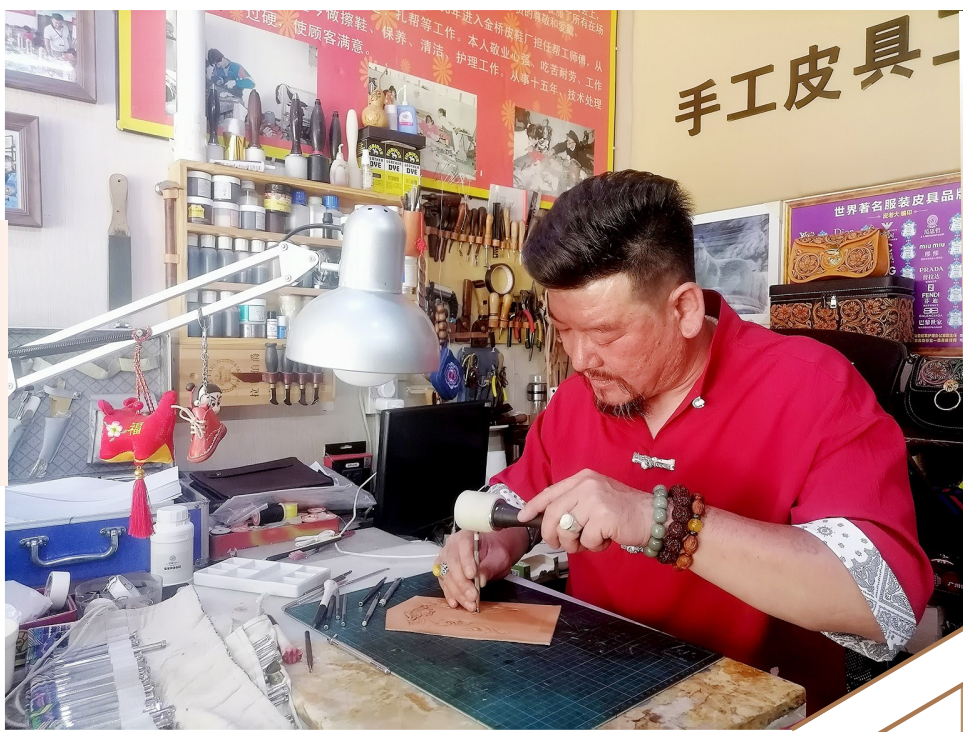
郭靖精心制作非遗产品。