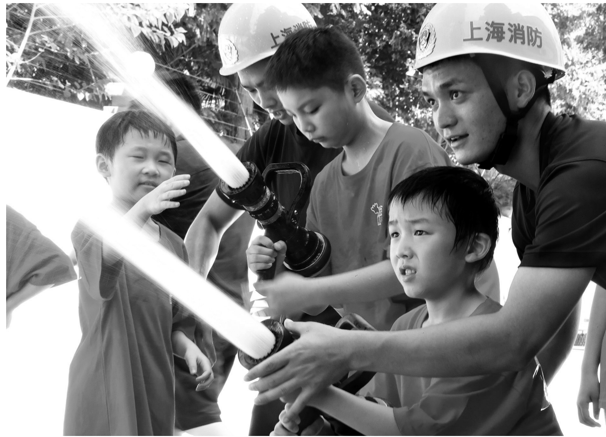
7月5日，消防员协助小学生操控消防水枪。

当日，上海市长宁区消防救援支队延安救援站举行了“暑期消防夏令营启动仪式”，辖区内的一些小学生在消防员的带领下，体验灭火救援装备、个人防护器材，学习消防安全知识。