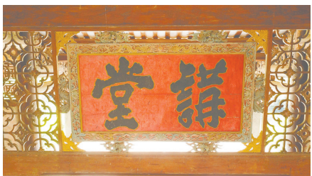
溪北书院匾额“讲堂”。

轴线上的第二处建筑便是讲堂，这也是书院里最为重要的部分，是日常老师讲课所在，跟现在的教室是同种功能。上悬“讲堂”名匾，是潘存亲笔所书。巧合的是，“讲堂”的“講”字同样少了一豎。