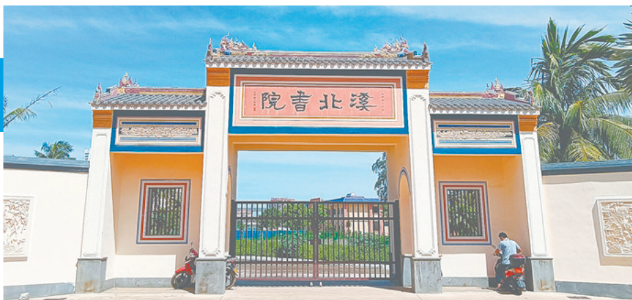
溪北书院新修院墙的大门，匾额仍沿用杨守敬的字迹。

缺一横笔的“書”和缺一笔的“講”字，到底是师生应和还是残缺之美?今天大概难有定论。但后人更愿意认为，这是中国书法史上意义深远的两个残缺字，是潘存及其学生在告诫后人：作为师长，毕生有讲不完的学;作为学生，毕生有读不完的书。学海无涯，要刻苦自励、孜孜不倦，由此可见一代名家潘存的良苦用心。