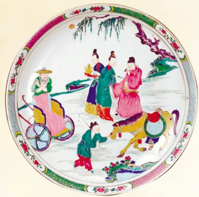
雍正粉彩瓷 前无古人后无来者

雍正粉彩在我国陶瓷发展史上占有很重要的历史地位,以精巧细腻著称于世,具有高贵、华丽、艳而不俗、细而不繁的美感,达到粉彩瓷器的顶峰。我国著名瓷器专著《陶雅》中称誉:“粉彩以雍正朝最美,前无古人,后无来者,鲜艳耀眼”。