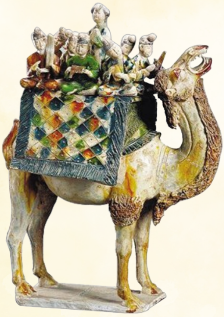
载乐骆驼俑 中国古代陶俑极品