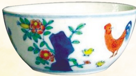
明成化斗彩鸡缸杯 千金难求

雍正一朝虽仅13年,但政局平稳,百姓安居乐业。雍正皇帝对瓷器特殊偏爱使此时的景德镇瓷业较前又有了很大的发展,瓷器品种繁多,釉色齐备,被誉为历代之冠。瓷器纹饰中的人物故事画题材选择不仅广泛,而且描绘细腻,人物比例恰当,更富有书卷气,“兰亭会”笔筒就是其中的佼佼者,代表了雍正时期笔筒艺术的最高水平,具有浓郁的历史文化意蕴和书法文化气息,极具艺术魅力,不仅有很高的艺术欣赏价值,还是研究《兰亭序》的重要参考资料。