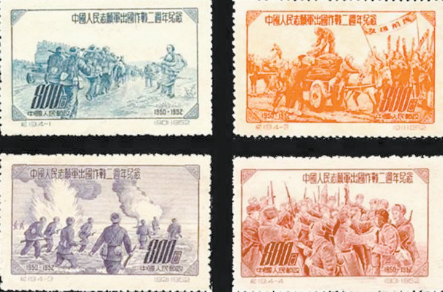
纪19《中国人民志愿军出国作战二周年纪念》邮票四枚。

1950年,朝鲜战争爆发。同年10月,中共中央作出了抗美援朝、保家卫国的历史性决策,打响了保家卫国的正义之战。1951年,中共中央决定10月25日为“抗美援朝纪念日”。1953年7月27日,《关于朝鲜军事停战的协定》签署。