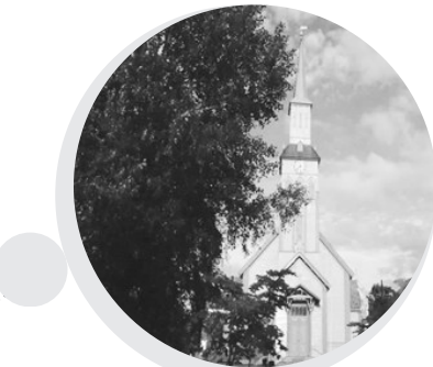
北极挪威通索（北纬69度）生长的大树。

近代欧洲人在所有饮料里加糖。巧克力，美洲人嚼苦的，咸的，欧洲人嚼甜的。咖啡，阿拉伯人掺肉桂，欧洲人掺糖（当年里斯本人在咖啡里放糖之多，连勺子都能立起来）。糖跟各种成瘾物似乎有一种天然的契合。欧洲人在酒里掺糖；近代印度生产大麻和鸦片要掺糖；美洲的烟草也要混合糖和糖蜜（生产蔗糖的剩余产品）来保鲜、上色、增添滋味。尤其重要的是近代欧洲人爱喝甜茶。1750年一位英国医生说：“大多数人都觉得，茶里不放糖，就像酒淡而无味。”英国工业革命让许多人走入工厂，为了调剂枯燥劳累的生活，工人们不停喝茶，大量放糖。1740年英国人均消耗1.8公斤糖，1898年，人均消耗40公斤糖。当时英国人摄入热量的五分之一来自白糖。