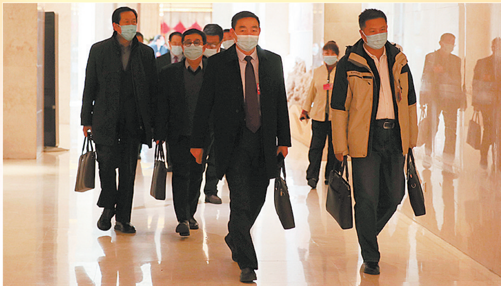
委员们意气风发地走向会场。

携良谋善策赴发展之约。1月18日上午,参加自治区政协十一届五次会议的政协委员们,带着全区各界群众的心声和期盼,怀揣着一件件沉甸甸的提案建议,以饱满的政治热情、良好的精神状态陆续来到会议驻地报到。