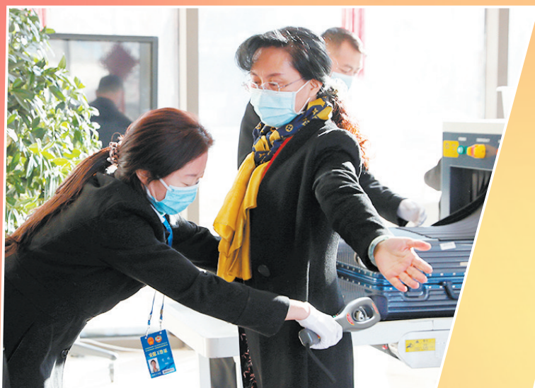
进入会场有序接受安检。