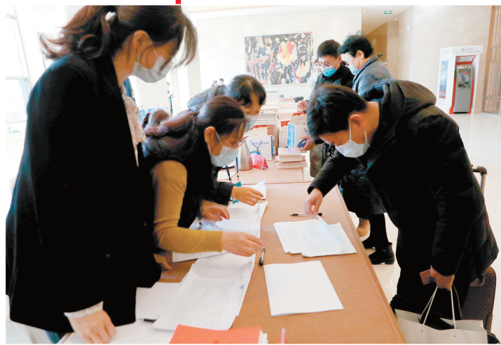
在工作人员引导下,委员们认真核对个人信息并领取会议材料。