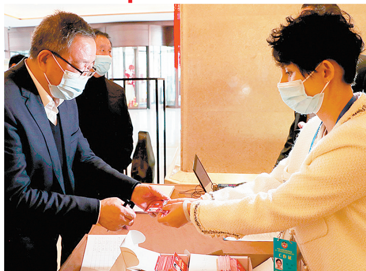
大会工作人员热情服务委员。