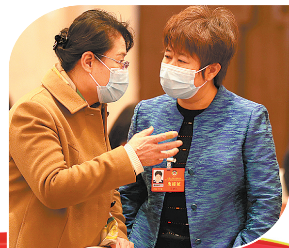
交流提案办理情况。