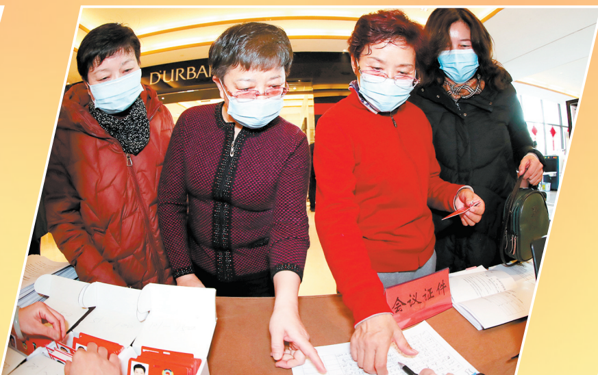
报到现场井然有序。