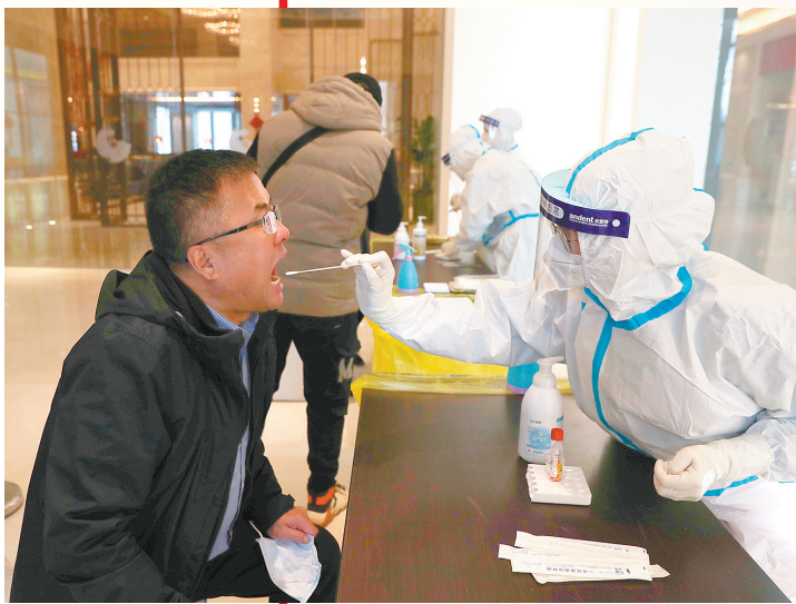
报到前接受核酸检测。