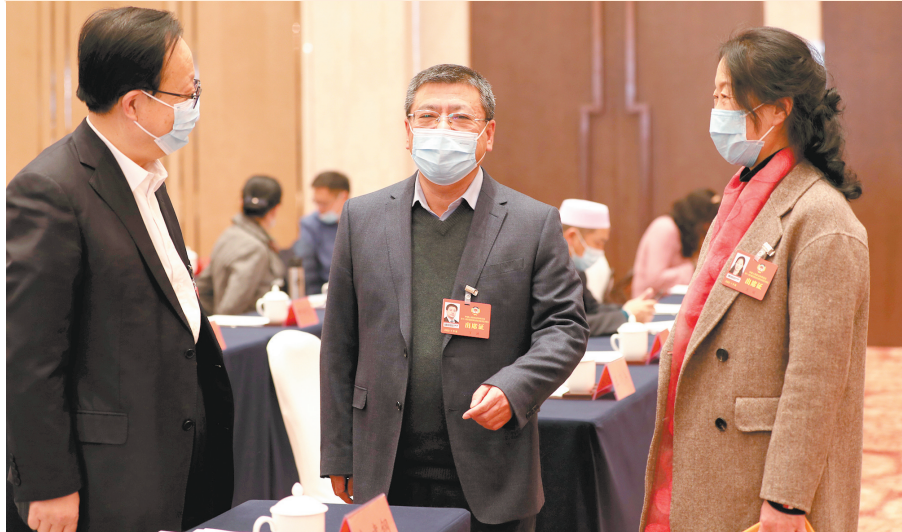
培训学习间隙,抓紧时间探讨联名提案。