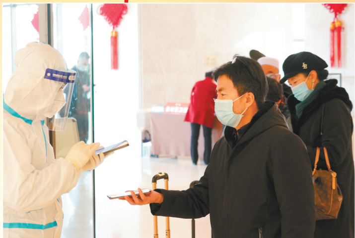
排队扫码准备做核酸检测。