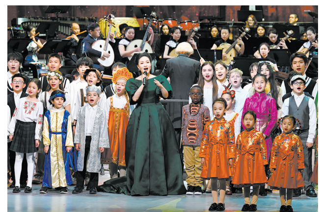
雷佳演唱歌曲《茉莉花》。

近日，“相约北京”奥林匹克文化节暨第22届“相约北京”国际艺术节在北京开幕。本届“相约北京”活动结合北京冬奥会、冬残奥会，包含表演艺术、视觉艺术、影视展映、城市活动、庆典活动等板块，将以“线上+线下”的形式，为观众奉献来自22个国家和地区的近百场展演活动，展现北京作为世界首座“双奥之城”的独特文化魅力。