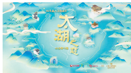
生态人文纪录片《太湖之恋》宣传片。(资料图片)

经过近两年的创制，生态人文纪录片《太湖之恋》于1月4日起每周二晚22时在东方卫视首播，该片分为《江南之心》《锦绣风物》《碧水入画来》3集，每集45分钟，着力展现近年来太湖流域城市在生态文明建设上所作的努力、人民安居乐业的美好图景。纪录片选用青绿山水加金色线条的全手绘风格，既与实拍画面交融、体现江南灵秀之美，又在配色上饱含“绿水青山就是金山银山”的美好寓意。