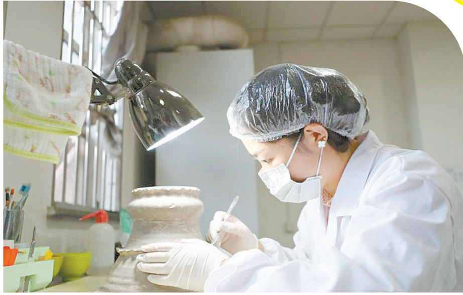
工作人员在修复文物。(资料图片)

据了解,截至2019年,宁夏博物馆馆藏文物总数为51298件,珍贵文物3551件,其中一级文物157件套。胡旋舞石刻墓门、鎏金铜牛、力士志文支座被鉴定确认为国宝级文物。西夏文物、北方青铜器的收藏数量和质量为文博行业所瞩目。