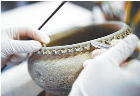
▲用刀尖轻轻刮去文物缝隙里的尘土。(资料图片)