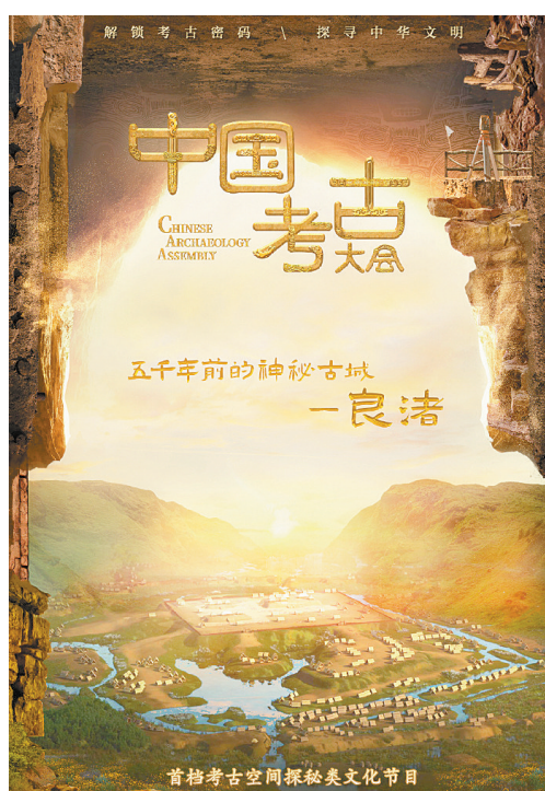
《中国考古大会》宣传海报(资料图片)

一把手铲,见证中华大地“满天星斗”;几代耕耘,赓续中国考古百年华章。2021年是中国现代考古学诞生100周年,《中国考古大会》秉持“让陈列在广阔大地上的遗产活起来”的创作初心,展现考古人对中华文明起源、发展脉络、灿烂成就和对世界文明的重大贡献。