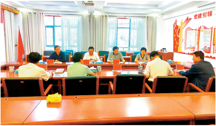
彭阳县政协党组成员召开党史学习教育会议。