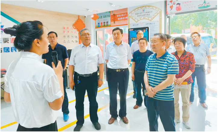
彭阳县政协赴红色教育基地开展爱国主义教育。