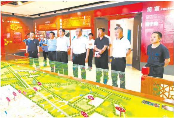
彭阳县政协视察全县“四个一”林草产业工程建设情况。