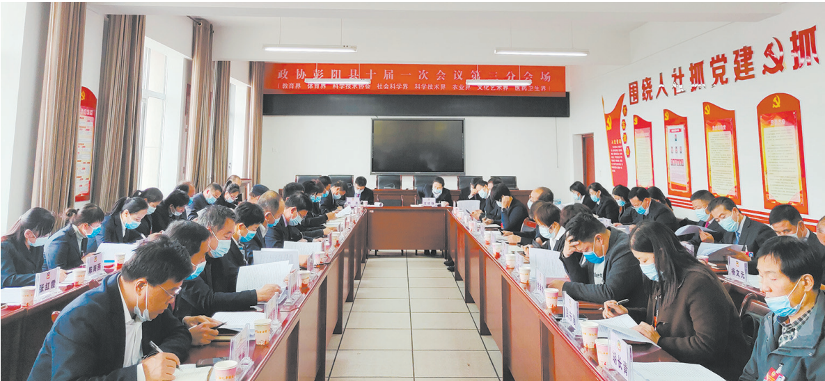
在彭阳县政协十届一次会议分组讨论会上,委员们就常委会工作报告和提案工作情况的报告展开热烈讨论。

宗教和顺、社会稳定。热情接待甘肃、福建、内蒙古、海南、辽宁等区内外政协考察团13批次,在交往交流、宣传推介中凝聚共识。组织举办了“加强宁夏澳门中药材产业合作,促进宁夏中药材产业发展”专题协商现场会,推动彭阳县与港澳地区合作交流。注重以文化人、以史资政,先后搜集整理《清未来过彭阳的克拉克探险队》《徐锡龄同志谈固北县委和固原县委》《皇甫谧籍贯考辨》等文史资料近8万字,编纂出版《彭阳东西南北人》《彭阳革命史料选编》,挖掘历史文化,讲好“彭阳故事”。发挥宣传舆论引导作用,加强委员履职通、微信公众号、《彭阳政协》等阵地建设,受邀参加2019美丽乡村博鳌国际峰会,走进央视网乡村直播间,推介彭阳生态建设成果,讲述彭阳脱贫攻坚故事,不断增强政协传播力、引导力、影响力。