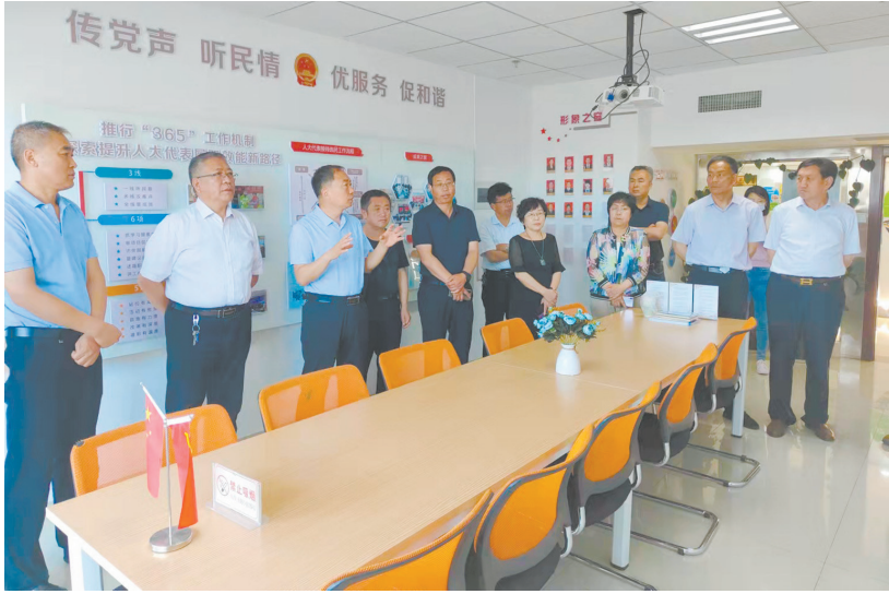
彭阳县政协组织委员开展党史学习教育。