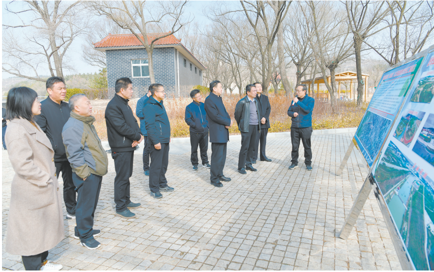
固原市政协、彭阳县政协两级联动,调研“推进全面依法治市”情况。

当历史的车轮驶入2021年,九届固原市彭阳县政协已走过5年的精彩历程。翻开五年来彭阳县政协工作日程,循着时间的节点回望,“力促发展”“情系民生”“团结协作”等一串串关键词跃然眼前。 五年来,累计精选委员大会发言56件、采纳委员意见建议227条、提交提案450件……一组组数字见证着九届彭阳县政协履职建言的坚实足迹。走乡村、进工厂、下社区,听民声、察民情、问民意……一次次深入实际、深入群众的考察调研,记录下彭阳县政协履职为民的生动实践。 五年来,九届彭阳县政协在中共彭阳县委的坚强领导下,牢牢把握团结和民主两大主题,紧紧围绕中心大局,发挥人民政协凝聚人心、汇聚力量的优势作用,推进建言资政和凝聚共识双向发力,为决胜全面建成小康社会、决战脱贫攻坚,推动彭阳县高质量发展贡献了智慧和力量。