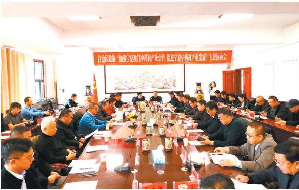
彭阳县政协协助自治区政协举办“加强宁夏澳门中药材产业合作,促进宁夏中药材产业发展”专题协商现场会,推动彭阳县与港澳地区合作交流。