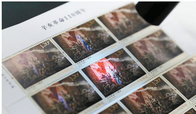
图为邮票在紫外灯下可看到城墙外红色的火光,生动还原画作背景。

位于中宁县石空镇的中宁三中,每逢大课间就能听到奋进的鼓点,学生们走出教室,在有节奏的队形变化中打钱鞭,强身健体。2008年9月11日,自治区成功举办了首届阳光体育文化节,在开幕式上,中国民间艺术家协会向中宁三中颁授了“宁夏回族自治区阳光体育文化之校”和“宁夏回族自治区非物质文化遗产代表性项目黄羊钱鞭传承保护基地”匾牌,使中宁三中成为全国第一个正式命名的“中国钱鞭文化之校”和唯一的“中国钱鞭文化传承基地”,给钱鞭的发展注入了强大的生命力。2008年,中宁县还将“黄羊钱鞭”确立为中宁县第三中学的校本课程,并通过挖掘和整理历史资料编写了校本教材《钱鞭情韵》,其中包括历史渊源、道具、服饰、音乐风格、武打动作等系统内容。至今,已有近万名学生带着“黄羊钱鞭”文化走出校园。据悉,该校将钱鞭教学内容归纳为表现劳动人民对风调雨顺、幸福安乐生活祈盼的《祝福篇》;表现五谷丰登、硕果累累丰收喜悦的《丰收篇》;表现与时俱进、开拓创新生活向往的《欢庆篇》;表现国家富强、民族振兴、人民幸福的《复兴篇》。突出了钱鞭表演形式的多样性、内容的丰富性、动作的协调性和表演的艺术性。现在,中宁三中已成为这项非遗实现“活态传承”的活跃阵地,不仅形成了独特的校园文化,更把家乡的传统文