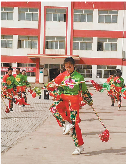
中宁三中的学生们在表演钱鞭。