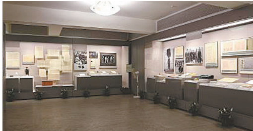
上海宋庆龄故居展厅。

的遗志,这是我应尽的责任。”每逢孙中山诞辰和忌日,宋庆龄都会把自己关在房间里,对着丈夫的遗像默默寄托自己的哀思。在她上海和北京的寓所,到处都悬挂、摆放着孙中山的照片或是画像。在上海宋庆龄故居纪念馆中,还陈列着一枚珍贵的印章——中华民国陆海军大元帅之印。此印为青田石质,高13.4厘米,印面为7.5×7.5厘米,朱文、篆文、阔边、无边款。1923年3月1日,孙中山在广州设立国民党最高军政机关——陆海军大元帅大本营,孙中山担任大本营最高职务——中华民国陆海军大元帅,孙中山以中华民国陆海军大元帅名义发布的命令、宣告、布告均盖此印。该印一直由宋庆龄精心保存在上海的寓所,她逝世后工作人员在整理遗物时得以发现,为馆藏国家一级文物。2021年,这枚珍贵的印章入选《上海市第一批革命文物名录》。文物见证历史,这些时光的留存再现了孙中山与宋庆龄传奇的人生经历,承载了他们家的记忆和国的情怀。它们不仅是历史的载体,更是开展研究的生动史料,是大众了解这对伉俪的宝贵资料。(据《新民晚报》)