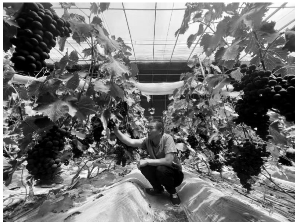
在贺兰县新平园区，农户打理葡萄。