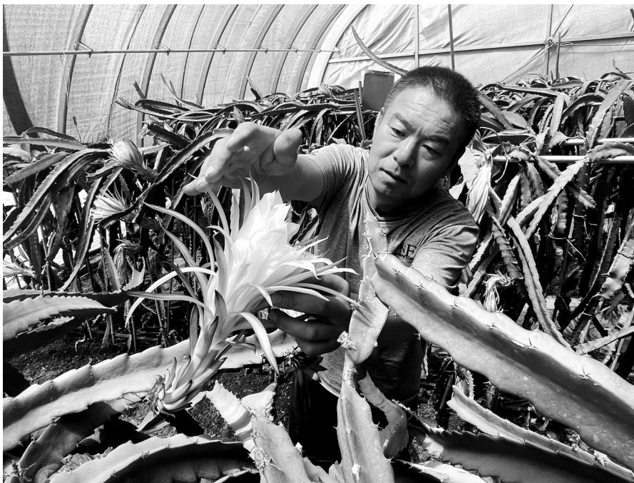
在贺兰县新平园区，农户给火龙果投粉。

今年，自治区政协委员袁荣提交《关于大力发展宁夏特色种植业的提案》。提案中指出，近年来，我区以特色产业建设为抓手，不断完善工作机制，创新工作方法，扎实推进乡村振兴战略实施，为推动宁夏经济社会持续健康发展发挥了重要作用。但特色产业发展还存在一些问题，如品种经营混乱，栽培技术粗放，缺少专业的技术力量等。