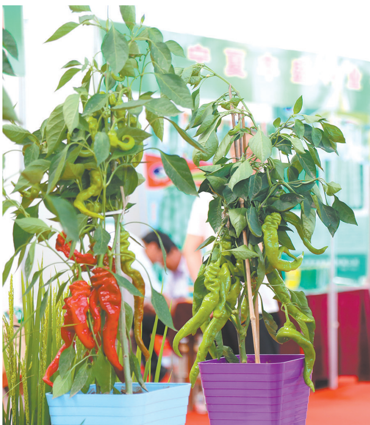
参展企业展示种植的辣椒。