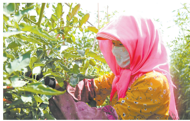
在平罗县种子小镇泰金种业产业园的种植基地,农民整枝打叉。

在本次博览会前期项目洽谈活动中,已有22家企业与平罗县企业达成20项合作协议,签约资金9.35亿元。博览会期间,将开展现代种业发展交流座谈会、种业高峰论坛、优胜企业评选、基地采摘、观摩考察制种基地及农作物种植基地等活动。