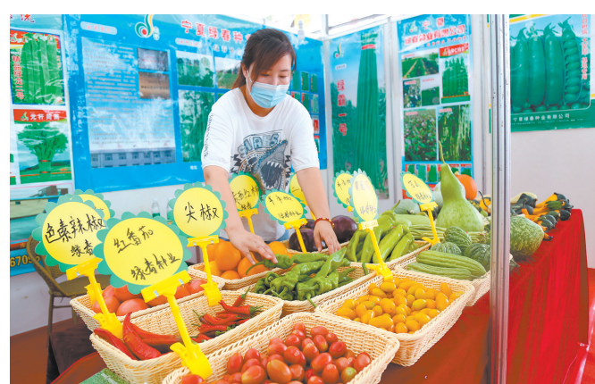
参展企业负责人整理自家种出的蔬菜。