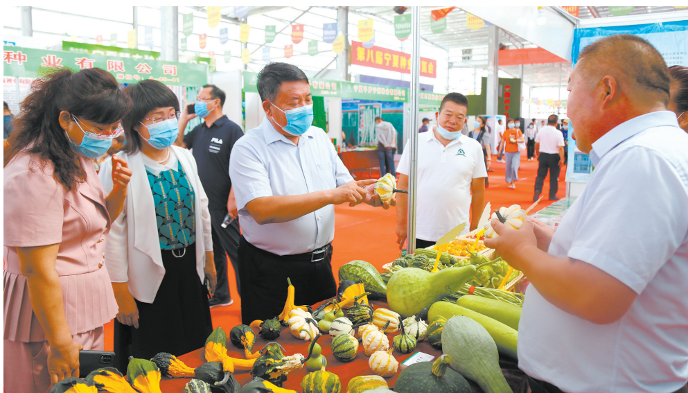
嘉宾和参展企业负责人共同探讨种子种植情况。