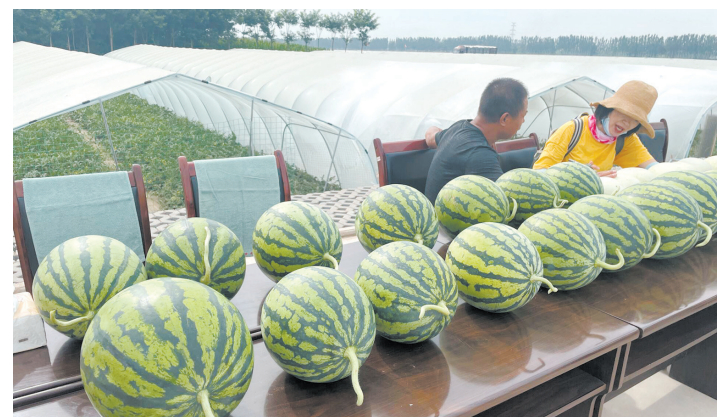
农户展示自家大棚里的优质西瓜。