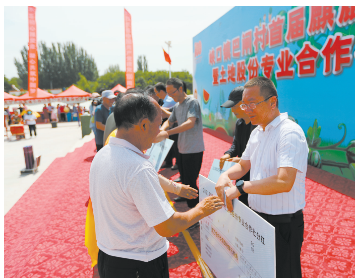
巴闸村土地股份专业合作社为股民分红。