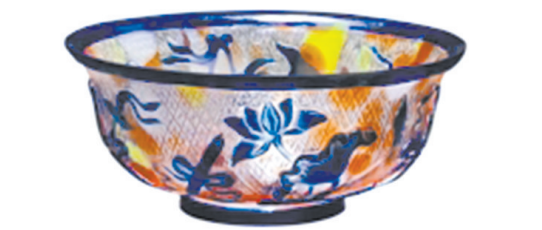
清乾隆七彩套料八宝琉璃碗,成交价:17.025万元,浙江佳宝2019年秋季艺术品拍卖会。

在去年9月份举行的纽约苏富比2020秋季纽约亚洲艺术周上,一件高35.1厘米的战国青铜错金银嵌琉璃乳钉纹方壶,录得830.7万美元(约合人民币5674.5万元)的成交价,一时间成为海内外华人收藏圈中传阅度较高的拍品。人们不仅为其精湛的错金银工艺所震撼,同时器身镶嵌的精美琉璃饰,也成为人们探讨的焦点。