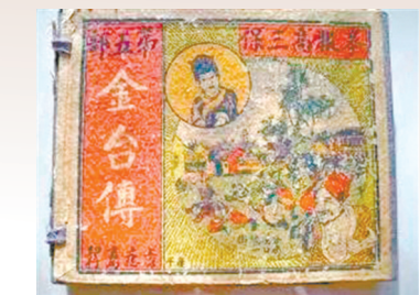
民国时期版《金台传》。

从上世纪90年代后期起,沉寂已久的连环画峰回路转,成为了收藏市场的宠儿,与邮票、钱币、火花、磁卡等并列为八大小众收藏品。