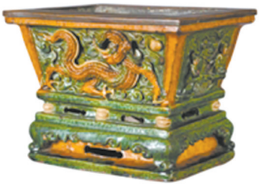
明嘉靖琉璃高浮雕龙纹方炉,成交价:25.3万元,北京保利2015春季拍卖会。