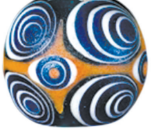
蜻蜓眼琉璃珠,成交价:48.3万元,上海匡时2020春季艺术品拍卖会。