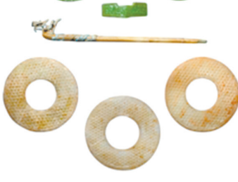
汉——宋琉璃玉璧五件,琉璃剑格和琉璃簪子各一件,成交价:12.98万港元,中国嘉德香港2017春季拍卖会。

最近两年,琉璃艺术品的成交量和顶级精品的成交价继续呈现上扬态势。如在2019年香港苏富比秋季拍卖会上,一件唐琉璃宝钵的成交价高达437.5万港元。拍品资料显示,此钵宽31厘米,吹制而成。匠人吹制此钵时,琉璃大泡渐渐成形,圆浑曲弧,却因体重微微下坠。如此大钵制造必需能匠巧工所不能为。传世唐代琉璃器极罕,各有不同,往往大相径庭,此器素雅大方,出版文献却无一近例可考。在随后举行的浙江佳宝2019年秋季艺术品拍卖会上,一只色彩斑斓的清乾隆七彩套料八宝琉璃碗的亮相,惊艳了众多藏家目光,最终录得17.025万元成交价。而在2020年8月举行的上海匡时春季艺术品拍卖会上,一件体型较小(直径2、高1.8厘米)、色彩绚丽的蜻蜓眼琉璃珠,也拍出了48.3万元高成交价。