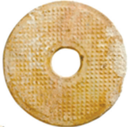
汉代琉璃蝉及琉璃璧,成交价:2968欧元(约合人民币2.395万元),伦敦苏富比2015春季拍卖会。