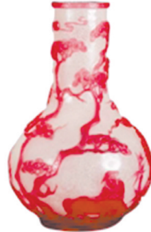
清咸丰琉璃套红松竹梅三友图天球瓶,成交价:12.32万元,西泠印社2010年秋拍会。