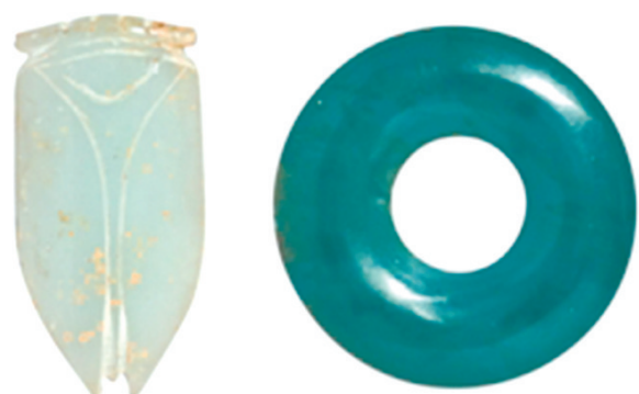
▲汉代琉璃蝉及松石绿琉璃环,成交价:4375美元(约合人民币3.11万元),纽约苏富比2019年秋季纽约亚洲艺术周。