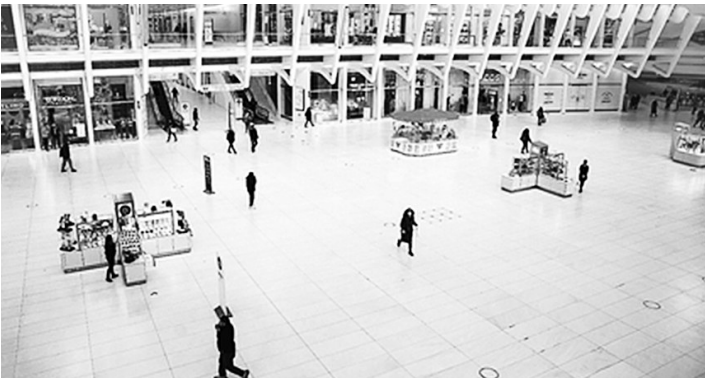
1月28日,人们走在美国纽约世贸中心车站内。