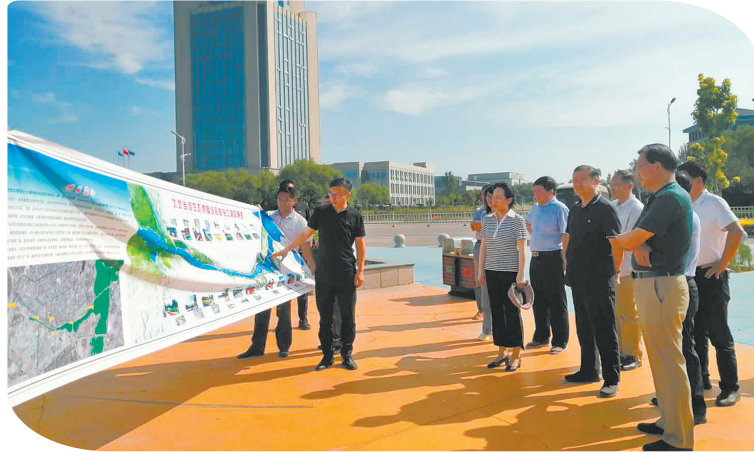
石嘴山市政协调研城市特色建设。

征程万里风正劲,重任千钧再奋蹄。回看2020年履职道路,每一个数字背后都是委员们履职尽责的身影,每一个建议和活动,都彰显了市政协实担当的精神;展望2021年,石嘴山市政协必将更加紧密团结在以习近平总书记为核心的党中央周围,在中共石嘴山市委的领导下,以奋发有为的精神状态、务实重干的工作作风、齐心协力、开拓进取,奋力开创新时代政协事业新局面,以优异成绩迎接建党100周年,为争当先行区建设排头兵、加快建设创新型山水园林工业城市、继续建设美丽新宁夏、夺取全面建设社会主义现代化新胜利而努力奋斗!