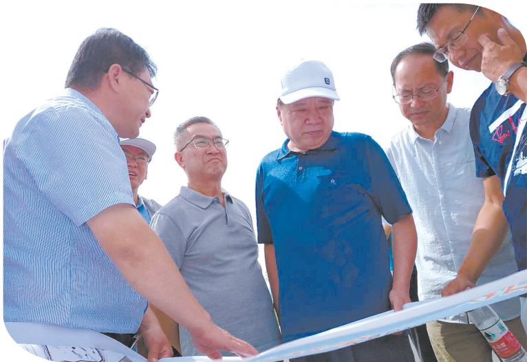
石嘴山市政协开展黄河流域石嘴山段水污染防治专题协商调研。

一年来,石嘴山市政协分层次建立习近平新时代中国特色社会主义思想学习研讨会和学习座谈会制度,认真落实党委会同政府、政协制定年度协商计划制度,严格落实“不学习就不调研,不调研就不协商”等规则,出台《提案办理协商办法》《协商议政质量评价办法》等10项制度,完善委员履职档案,建立健全委员培训学习、履职情况统计通报制度,制定《委员退出与暂停履职管理办法》《常委、委员述职点评制度》,对标对表建立任务清单,逐项逐条推进任务落实,破解基层政协“两个薄弱”,深入开展“文化机关·书香政协”品牌创建活动,厚植协商文化根基,积极创建让党中央放心、让人民群众满意的模范机关。