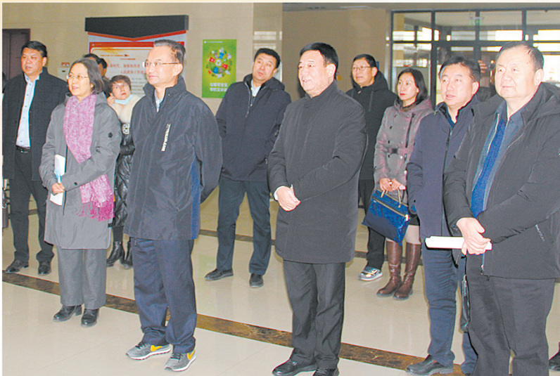
石嘴山市委书记王文宇(前排左二)督办以《提高本土高校服务地方能力为突破口助推石嘴山市引人留人能力的提案》。

此外,石嘴山市政协还推进政协协商向基层延伸,全年共开展“政协开放日”“委员基层行”“委员大讲堂”“界别委员工作室”等活动27次。探索“协商+”履职新模式,建成“云视讯”移动协商系统,开展网络议政7次,拓展政协协商参与面。