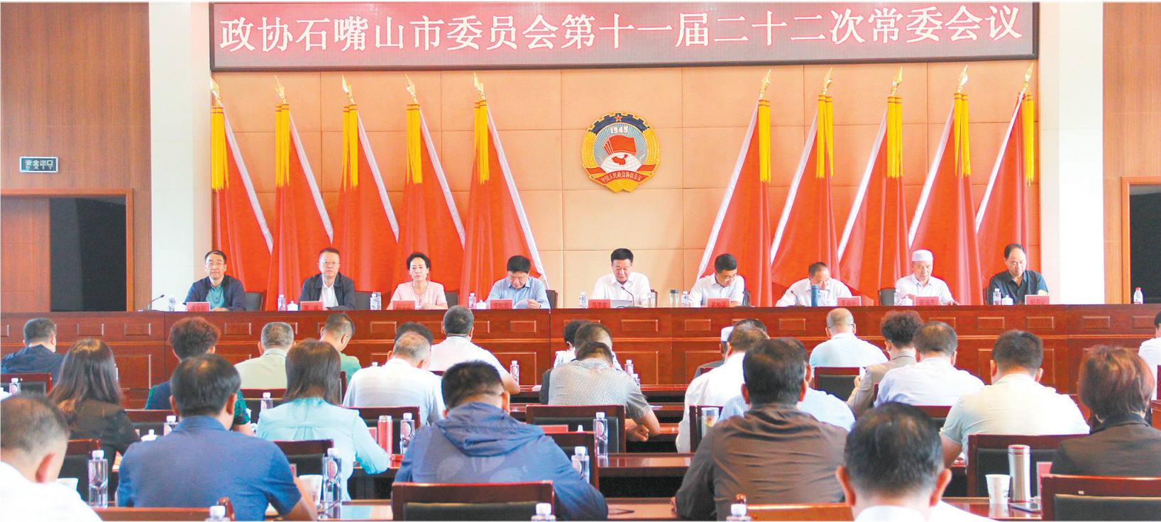
石嘴山市政协十一届常委会第二十二次会议召开。