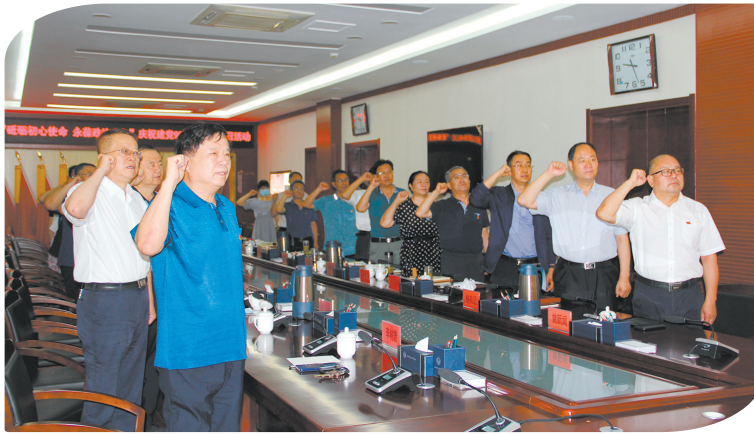
石嘴山市政协机关党组开展“砥砺前行使命 永葆政治本色”主题党日活动。