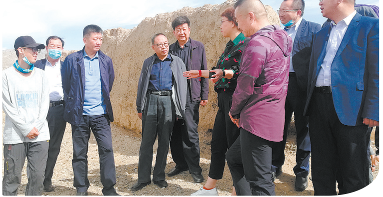
石嘴山市政协开展生态工业文化旅游调研。