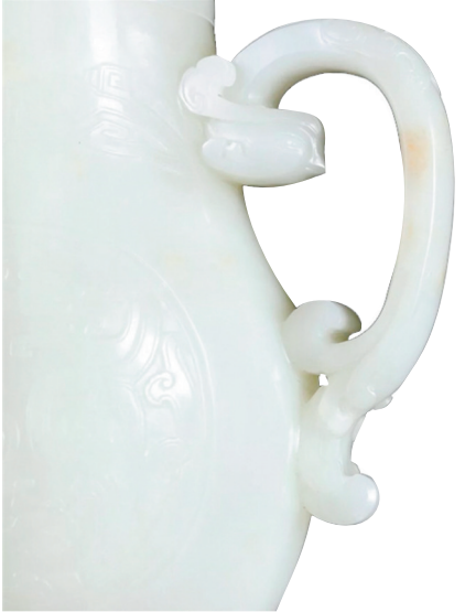
清乾隆 白玉雕开光瑞龙 捧寿纹龙凤执壶。

明代玉器的纹饰和装饰手法丰富,有动植物、花鸟、人物、山水题材图案,还盛行以图案为底纹或边饰万字、喜字、寿字、流云、朵云、波浪等。因深受文人画艺术的影响,在玉器上还出现了前所未有的诗书画印艺术。同时,符瑞吉祥的谐音题材大为流行,隐喻吉祥的纹饰在玉器上比比皆是。及至清代,玉器得到了空前发展。清代玉器的品种和数量繁多,以陈设品和佩饰最多。新增的品种有玉山子、浮雕图画式的玉屏风等。清代玉器善于借鉴绘画、雕刻、工艺美术的成就,集阴线、阳线、镂空、俏色等多种传统做工及历代的艺术风格之大成,创造与发展了工艺性、装饰性极强的玉器工艺。