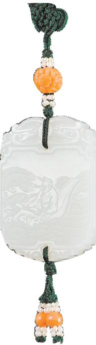
清乾隆 白玉 “太乙莲舟”牌。

清代玉器制造的全盛时期是乾隆时期。乾隆皇帝痴迷于玉,并将宫廷玉作为一种文化推向极致,他首创创意玉器,将玉器引入观赏书画的概念;亲自钦定玉器,设立玉器等级制度。他更对夏、商、周三代的古玉进行广泛收集,认真鉴别,对于制作较粗糙的玉器,交由清宫造办处加工改制,因此清代宫廷遗留下来的玉器中常见旧玉后刻花、旧玉新做工。北京造办处、扬州和苏州云集了众多的能工巧匠,雕琢精益求精。从清代宫廷玉器的数量、品种、加工技术、装饰纹样来看,清代玉器达到了我国玉器发展的顶峰。