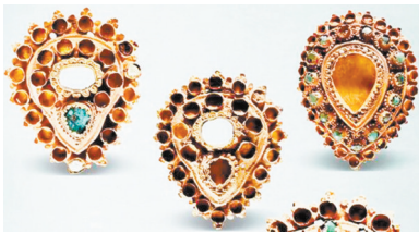
▲▼桃形镶嵌宝石金冠饰。