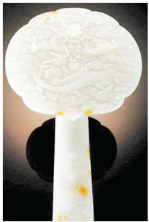
清乾隆 白玉雕 正卧龙纹福寿如意。