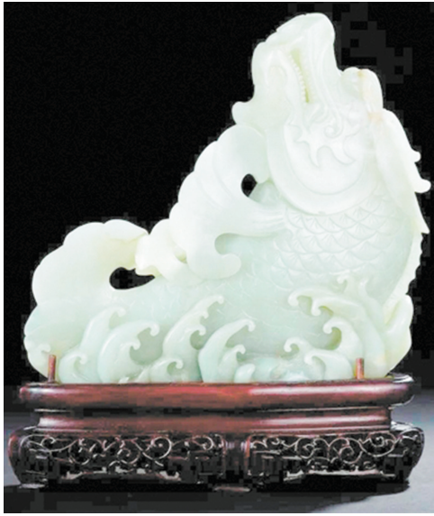
清乾隆 青白玉鱼化龙花插。

清代玉器制造的全盛时期是乾隆时期。乾隆皇帝痴迷于玉,并将宫廷玉作为一种文化推向极致,他首创创意玉器,将玉器引入观赏书画的概念;亲自钦定玉器,设立玉器等级制度。他更对夏、商、周三代的古玉进行广泛收集,认真鉴别,对于制作较粗糙的玉器,交由清宫造办处加工改制,因此清代宫廷遗留下来的玉器中常见旧玉后刻花、旧玉新做工。北京造办处、扬州和苏州云集了众多的能工巧匠,雕琢精益求精。从清代宫廷玉器的数量、品种、加工技术、装饰纹样来看,清代玉器达到了我国玉器发展的顶峰。