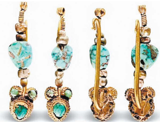
桃形镶嵌宝石金耳饰(正、背)。

党项族是古代北方少数民族之一,属西羌族的一支,故有“党项羌”的称谓。据载,羌族发源于“赐支”或者“析支”,即今青海省东南部黄河一带。在经济、文化方面与中原来往密切,因此形成了具有自己特色的金银器文化,据文献及出土文物可知西夏金银器制作水平不低。