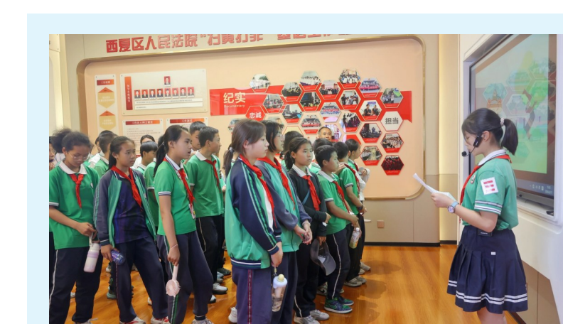
近日,西夏区第三小学的学生们走进西夏区法院“夏小阳青少年法学院”,跟随4名“小讲师”共上一堂别开生面的法治实践课。 近年来,西夏区法院依托“夏小阳青少年法学院”和“红领巾讲师团”等特色载体,充分发挥“五老”宣讲团的育人作用,打造“同龄人讲给同龄人听、老前辈讲给孩子们听”的普法教育模式,将法治信仰与红色基因深植青少年心田。

本报讯 近日,贺兰县商旅文体体夏日消费季配套活动——“票根联动2.0”惠民活动正式启动。活动将持续至8月31日,游客凭赛事门票、景区门票、购房购车发票等凭证,即可在全县数十家文旅商户享受专属优惠,一站式解锁全域旅游福利。 此次“票根联动2.0”在时长、适用商户及凭证类型上实现全面扩容:惠民周期由单月延长至两个月;联动点位拓展至景区、民宿、酒庄、乡村示范点四大板块;优惠凭证新增赛事门票、音乐节门票以及本地购房、购车发票,将市民的观演、观赛、置业购车等行为有效转化为文旅消费福利。 在具体操作上,游客只需出示贺兰县A级景区门票、马术赛事门票、贺兰山星空音乐节门票及购房购车发票等联动凭证(纸质票、电子二维码或购票记录均可),在参与活动的任一商户直接亮票核验即可享受优惠,且同一联动点不限使用次数。 “今夏贺兰”系列特色文体活动同步开展,与票根优惠叠加形成消费热潮。7月18日至19日,贺兰山星空音乐节开唱;此外,两场国家级马术冠军杯赛、“闽宁一家亲”全国垂钓大赛也将陆续举办。市民在观赛听歌后,可凭票根游览景区、品鉴葡萄酒、入住特色酒店。(刘媛)