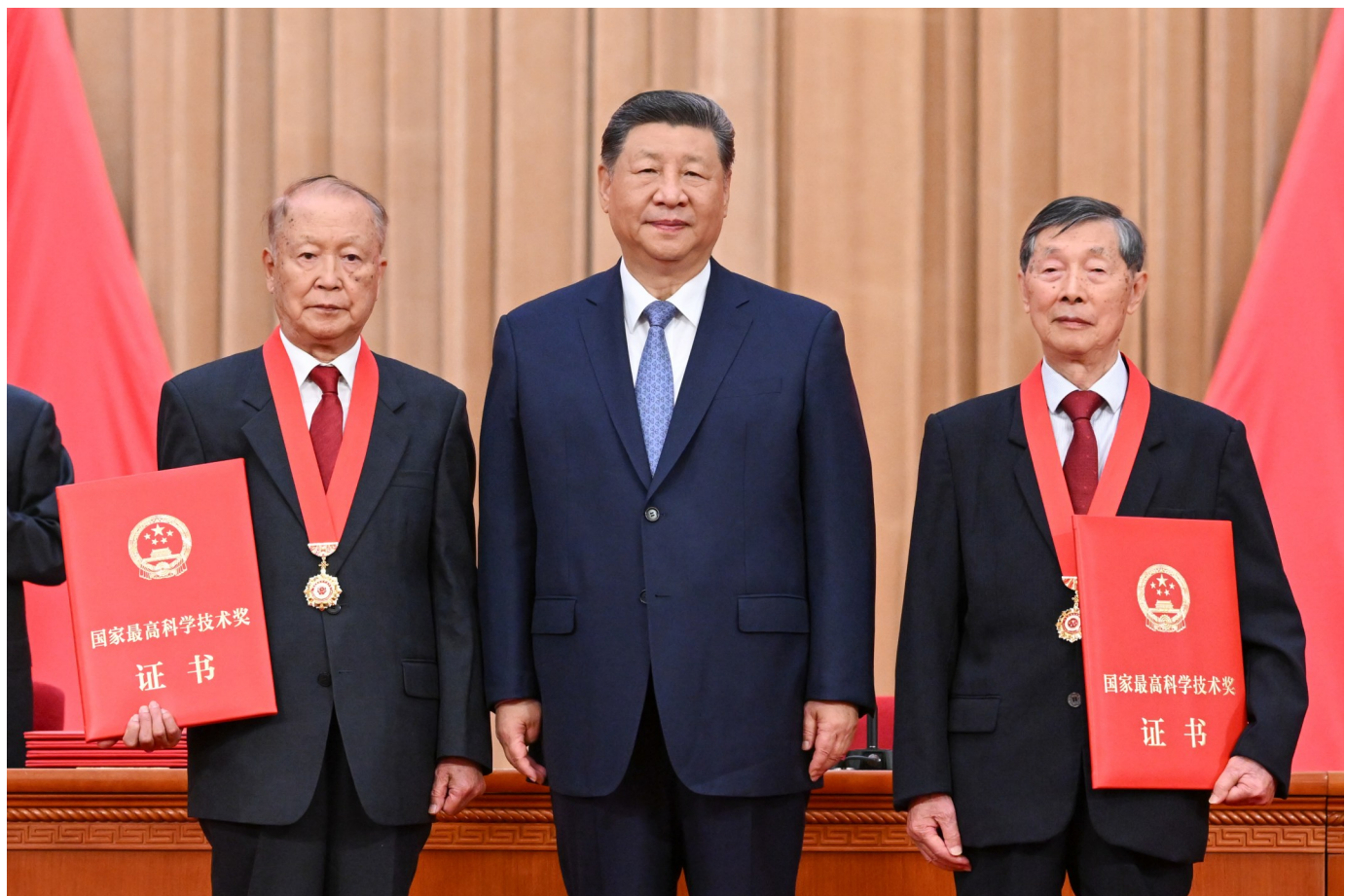
7月8日上午，国家科学技术奖励大会、中国科学院第二十二次院士大会和中国工程院第十八次院士大会、中国科学技术协会第十一次全国代表大会在北京人民大会堂隆重召开。中共中央总书记、国家主席、中央军委主席习近平向获得2025年度国家最高科学技术奖的中国科学院物理研究所陈立泉院士(右)和中国电子科技集团第十四研究所贾德院士(左)颁奖。

新华社北京7月8日电 国家科学技术奖励大会、中国科学院第二十二次院士大会和中国工程院第十八次院士大会、中国科学技术协会第十一次全国代表大会8日上午在人民大会堂隆重召开。中共中央总书记、国家主席、中央军委主席习近平出席大会，为国家最高科学技术奖获得者等颁奖并发表重要讲话。他强调，“十五五”时期是科技强国建设的关键攻坚期。必须抓住历史机遇，迎接时代挑战，加快推进高水平科技自立自强，向着到2035年建成科技强国的目标坚定迈进，扎扎实实以科技创新支撑和引领中国式现代化。