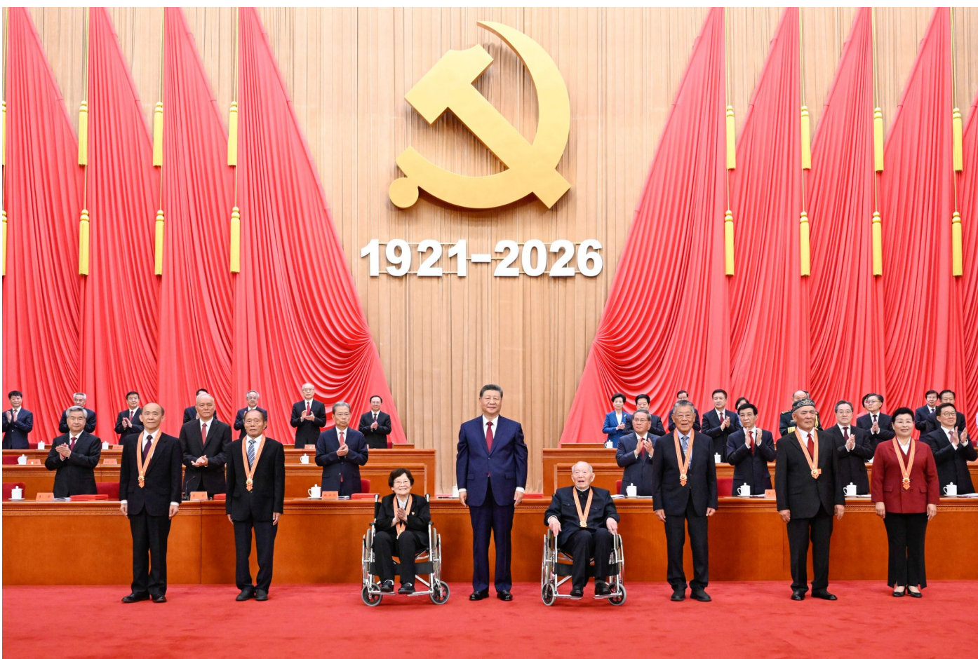
7月1日上午，庆祝中国共产党成立105周年大会在北京人民大会堂隆重举行。中共中央总书记、国家主席、中央军委主席习近平向“七一勋章”获得者颁授勋章。

新华社北京7月1日电 庆祝中国共产党成立105周年大会7月1日上午在北京人民大会堂隆重举行。中共中央总书记、国家主席、中央军委主席习近平向“七一勋章”获得者颁授勋章并发表重要讲话。他强调，105年来，我们党始终坚守为中国人民谋幸福、为中华民族谋复兴的初心使命，在不懈奋斗中创造了彪炳史册的伟大成就。新征程上，全党同志要坚定信心、接续奋斗，不断创造无愧于时代和人民的新业绩。