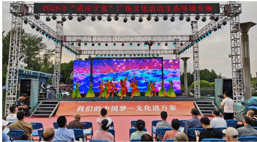
6月17日，2026年“清凉宁夏”广场文化活动生态环境专场举行，以歌舞、相声、诗朗诵、情景剧、音乐快板等形式的文艺表演，讴歌赞美“美丽宁夏”建设，吸引众多市民前来观看。该活动作为宁夏第四届黄河流域生态保护主题宣传实践月的重要内容之一，面向公众积极传递生态环保理念，营造了良好的社会氛围。

贺兰县坚持“以赛聚人、以赛兴旅、以赛促商”的发展理念，将高端赛事与夏日消费季深度绑定。通过打破业态发展边界，赛事流量正全面带动农产品展销、葡萄酒消费及乡村旅游升温，推动“酒庄变景区、赛事变流量、流量变消费”。贺兰县将全方位优化食宿、交通、安保等接待服务举措，全力保障赛事圆满举办。依托赛事IP持续放大品牌效应，全力打造区域体育文旅融合发展标杆，为县域经济高质量发展注入强劲动力。