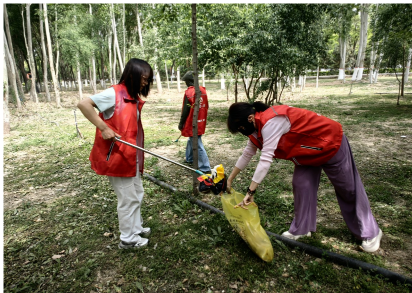
近日,金凤区香溪美地社区联合志愿者,深入辖区主次干道开展环境卫生清洁志愿服务活动。志愿者们沿途捡拾垃圾、烟头,清理绿化带白色垃圾,着力改善辖区环境面貌。

坚持即查即改、分类处置,针对机构注册资料残缺、组织名称不规范、服务活动台账缺失等共性问题逐条制定整改方案;对2家长期停摆、无实质服务的志愿服务组织,分类施策盘活运营或依规引导注销退出;督促6个违规网络账号完成更名整改或注销关停;整合优化156支布局零散、服务同质化的志愿队伍,实现行业底数明晰、整改举措精准、整治落地务实,夯实志愿服务常态化规范管理根基。常态化组织整治成效“回头看”,对照问题台账逐项核验整改成效,对整改浮于表面、落实不达标的主体限期返工整改,以常态化督查固化专项整治成果。