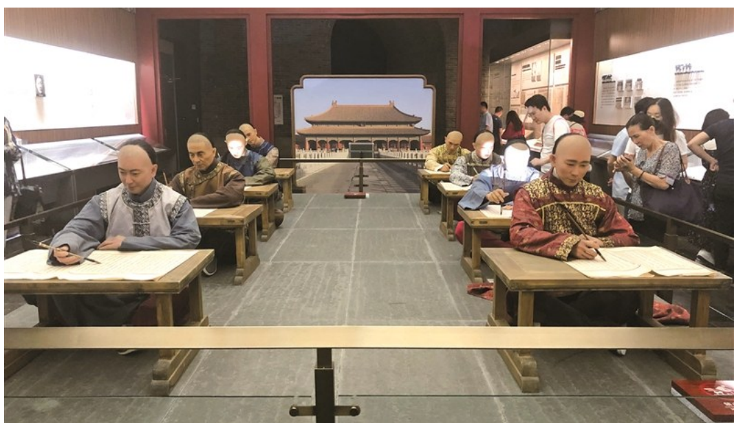
中国科举博物馆内清代殿试场景模拟图。