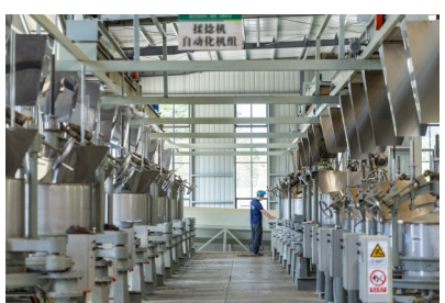
日前，在重庆市永川区红炉镇重庆西南茶叶集团，工人在查看自动揉捻机工作状态。

研学环节，参会人员走进志辉源酒庄葡萄种植园、酒窖，在感受贺兰山东麓葡萄酒产业独特魅力、了解产区生态保护、品质管控、品牌建设成果的同时，也深刻体会到法治护航特色产业高质量发展的重要意义。西夏区将聚焦葡萄酒、文旅等辖区重点产业，常态化开展精准普法、法治体检、专项法律服务等活动，不断延伸法治服务触角，夯实产业发展法治根基，以法治力量全力守护贺兰山下“紫色梦想”。