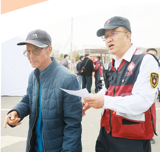
医护人员带村民做相关检查。