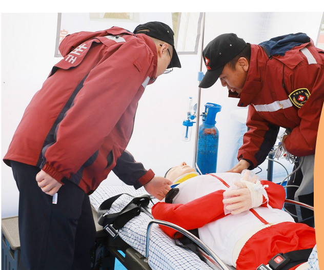
自治区人民医院的专家团队在义诊前进行应急演练。