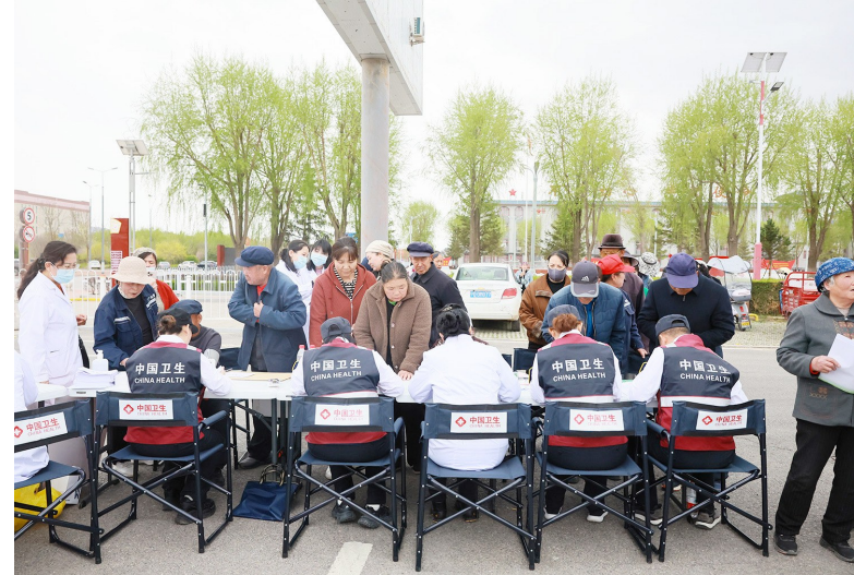
前来就诊的村民在分诊台前等待分诊。