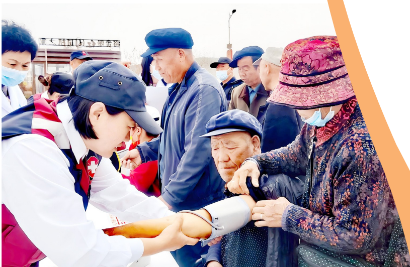
医护人员为村民测量血压。