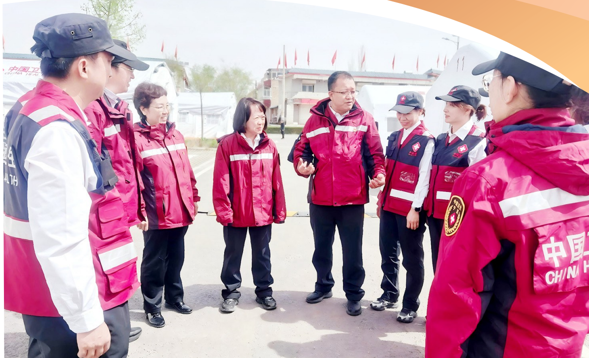
专家团队在义诊开始前进行协调部署工作。