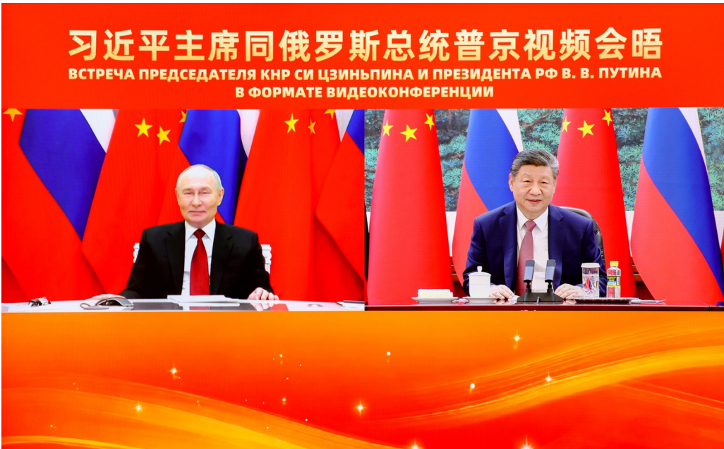
2月4日下午,国家主席习近平在北京人民大会堂同俄罗斯总统普京举行视频会晤。

新华社北京2月4日电 2月4日下午,国家主席习近平在北京人民大会堂同俄罗斯总统普京举行视频会晤。