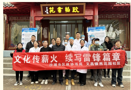
2025年3月5日,沙坡头区政协组织开展“文化薪火 续写雷锋篇章”健康义诊活动。

围绕“加强学前教育和托育服务,保障儿童健康成长”“优化营商环境,助力民营企业稳健发展”开展民主监督视察。对沙坡头区卫生健康局效能及行风建设开展民主评议活动,拓展民主评议监督、专项工作监督及政策落实监督等形式。听取沙坡头区综合执法局等6个部门重点工作汇报;组织委员集中观摩重大项目建设、重点提案办理情况;邀请政协委员参加沙坡头区相关部门的调查、检查、听证等活动50余次。组织开展“我为群众办实事”和“金点子”征集活动,通过社情民意等渠道广泛征集意见建议22条,遴选出涵盖医疗卫生、新能源产业等多个关键领域的“金点子”8条。坚持众人的事情众人商量,先后组织相关界别委员围绕“农村阵地建设及活动开展情况”“招商引资企业运营情况”等开展“有事好商量”协商4次,发挥多方主体议事协商作用,引导群众表达合理诉求。