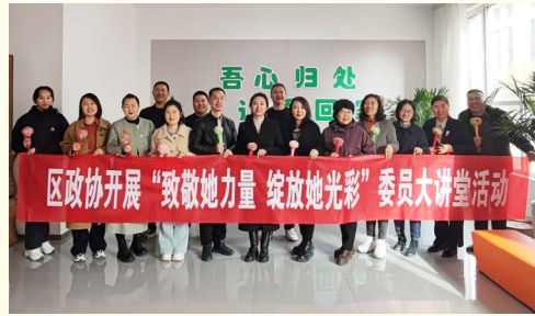
2025年3月14日,沙坡头区政协开展“致敬她力量 绽放她光彩”委员大讲堂活动。

制度,实现“两个全覆盖”。持续开展深入贯彻中央八项规定精神学习教育,开展交流研讨15场200余人次,举办读书班等活动,精准查找作风建设与政协职能衔接中的短板弱项。全面落实党的建设、意识形态及党风廉政建设主体责任,建立机关党组、机关党支部定期向政协党组汇报工作制度,把严的基调、严的措施、严的氛围长期坚持下去。