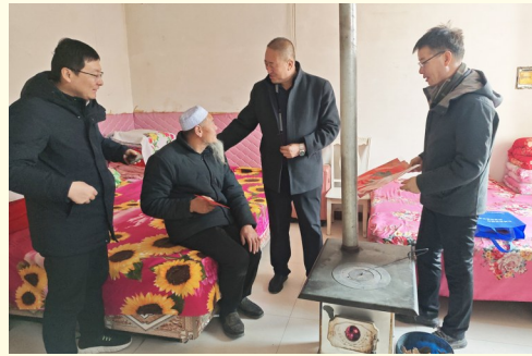
2025年1月22日,沙坡头区政协对困难群众进行走访慰问。