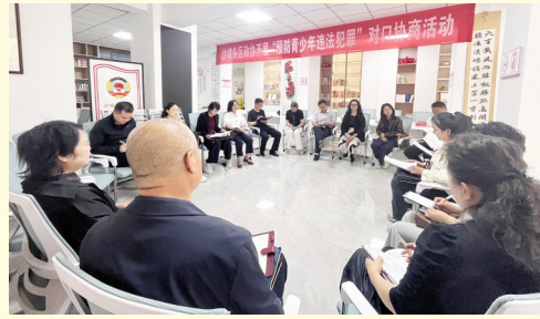
2025年5月22日,沙坡头区政协提案委员会开展“预防青少年违法犯罪”对口协商活动。