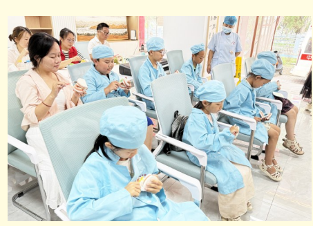
2025年7月29日,沙坡头区政协委员为辖区青少年讲解牙齿护理知识。