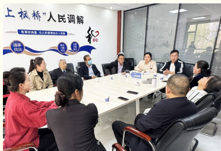
2025年4月15日,沙坡头区政协委员在滨河镇光明社区调解邻里纠纷。