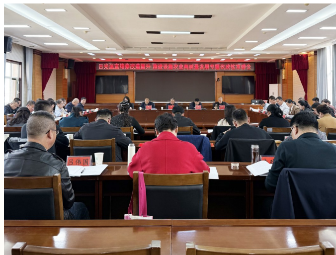
2025年10月30日,沙坡头区政协召开“日光温室维修改造提升 推进设施农业高质量发展”专题议政性常委会会议。

2026年,沙坡头区政协坚持以习近平新时代中国特色社会主义思想为指导,坚持党的领导、统一战线、协商民主有机结合,以铸牢中华民族共同体意识为主线,紧扣“大规划、大基地、大融合、大发展”,持续推进“抓产业、办实事、强治理、转作风”专项行动,以政治协商聚共识,以民主监督促落实,以参政议政助发展,建言资政和凝聚共识双向发力,深入践行全过程人民民主,为奋力谱写中国式现代化沙坡头篇章贡献智慧和力量。