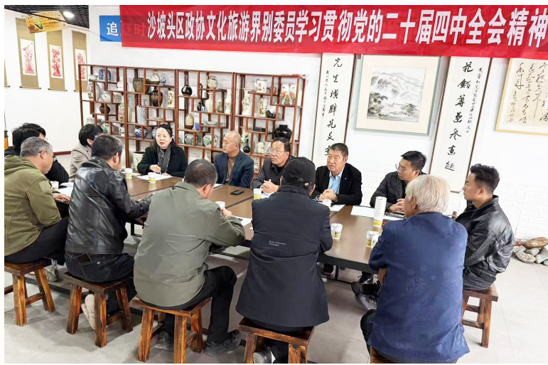
2025年11月7日,“石建武委员会客室”开展党的二十届四中全会精神学习交流研讨活动。