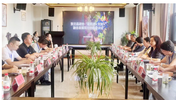
贺兰县政协围绕“葡萄酒+文旅”融合发展召开协商座谈会。