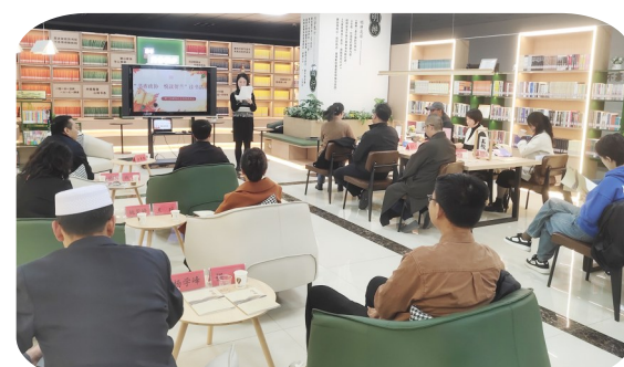
▲贺兰县政协持续深化“书香政协+”文化品牌建设，经常性开展委员读书活动。

民生福祉“价值”更优。深化“有事好商量”协商，围绕广荣村“党建直播间”功能优化、奥莱小镇便民金融服务覆盖等群众“家门口的关切”搭台协商。扎实开展“双月协商”，围绕“葡萄酒+文旅融合”等议题组织开展协商，提出意见建议40余条，助力解决民生实事6件。聚焦特殊群体急难愁盼问题，委员主动出资，帮扶168名“两参”人员、现役军人家属及30名困难学子；紧盯民生领域短板弱项，促成天鹅湖社区卫生站建成投用；聚焦青少年防溺水工程调研建言。