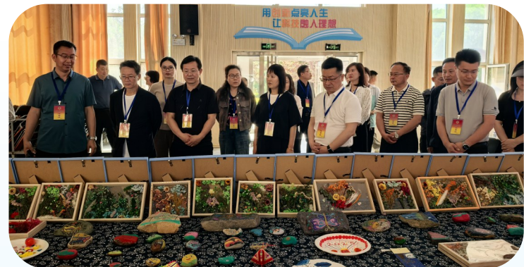
▲西夏区政协开展“加快西夏区中小学科学教育实验室建设 推进科学教育质量显著提升”专题调研视察。