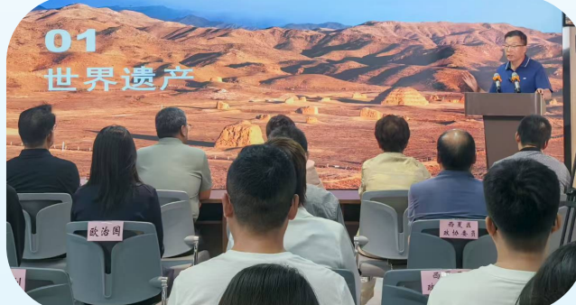
▲西夏区政协围绕“世界文化遗产——西夏陵”主题开展“委员大讲堂”活动。

思想决定行动，方向关乎全局。西夏区政协始终把坚持党的全面领导作为根本政治原则，把加强思想政治引领作为首要政治任务，深刻领悟“两个确立”的决定性意义，增强“四个意识”、坚定“四个自信”、做到“两个维护”。 坚持党的全面领导毫不动摇。坚持把区委对政协工作的全面领导贯穿到各个方面，做到重要精神及时传达、重要工作及报告、重大部署及时落实、重要协商成果及时呈报，全年向区委请示报告21次。健全党组成员联系民主党派、专委会联系界别、党员委员联系党外委员等制度，团结带领广大政协委员、各族各界人士主动投身高质量发展全局，确保政协履职与党政中心工作同频共振、同轴运转、同向发力。 强化理论武装常抓不懈。严格落实“第一议题”学习制度，以政协党组理论学习中心组为引领，构建“党组领学、支部研学、机关践学、委员自学”四位一体学习体系，全面系统学习“必读篇”、及时跟进学习“最新篇”、联系实际学习“行业篇”，增强政治协商、民主监督、参政议政的能力本领，全年开展理论学习36次、交流研讨8次。 深化党建引领提质增效。持续擦亮“党建引领凝聚共识，履职担当表率”品牌，选树第4批党员委员先锋岗10名，开展“党组+支部+党员委员”系列党建活动20场次。落实政协党组全面从严治主体责任，扎实开展深入贯彻中央八项规定精神学习教育，组织警示教育3次，观看警示教育片2次，开展专题交流研讨4次，营造风清气正的政治生态，实现党的建设与政协履职深度融合、互促共进。