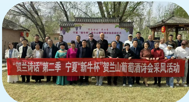
▲西夏区政协组织开展“贺兰山诗话”等主题诗会。