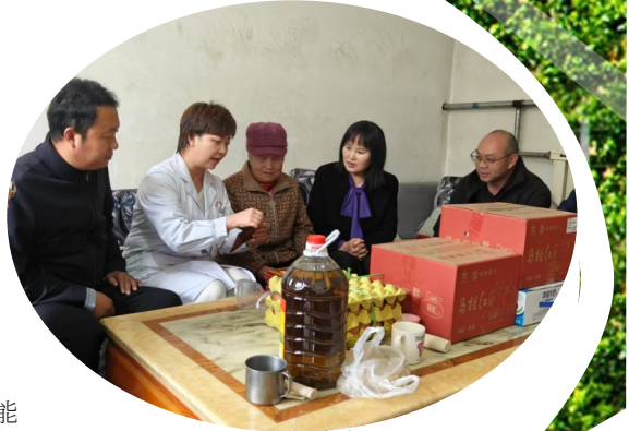
▲西夏区政协开展委员履职“服务为民”活动。

新时代需要新作为，新作为还须自身硬。西夏区政协始终把加强自身建设作为永恒课题，坚持制度管人、流程管事、文化润心，持续推动政协工作制度化、规范化、程序化建设迈上新台阶。 多措并举提升履职质效。围绕2次专题议政性常委会会议，创新采取专题座谈、预调研、外出“取经”等多种形式，进一步拓宽了协商路径，夯实了议政基础；围绕对口协商，建立专委会与党政部门对口联系机制，通过跨界别联合调研，使建言更具针对性和可操作性，提升了协商质效；围绕“社区食堂可持续运营”等议题进行分组调研、实地走访，查实情、谋良策，增强了调研实效；修订完善《西夏区政协提案工作办法》，优化常委会、主席会议、专委会工作规则，确保各项工作有制可依、有规可守、有序可循。 常抓不懈推进作风转变。以深入贯彻中央八项规定精神学习教育为契机，持续推进政协委员和机关干部“两支队伍”建设，坚持从严要求、从严教育、从严管理、从严监督，把“守纪律、讲规矩、重品行”贯穿在政协履职全过程。对照“五个进一步到位”要求，结合“转作风、树新风、打赢打好百口攻坚战”目标任务，抓好西夏区委第十一轮巡察政协机关党支部反馈意见的整改工作。将作风建设融入日常，抓在经常，开展机关干部走访企业委员活动，落实公文抄袭专项整治工