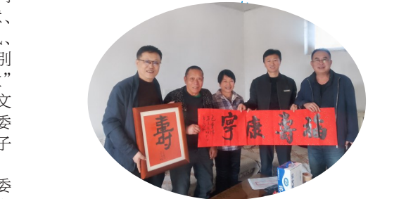
▲西夏区政协开展委员履职“服务为民”活动。

进企业活动等界别活动5场次。新成立“委员工作室”1个，提升改造“委员联系点”1个，委员履职“前沿阵地”作用进一步发挥。坚持“群众利益无小事”，推动政协协商与基层协商有效衔接，围绕“行政中心周边办事群众停车难”等开展“请你来协商”2次，就老旧小区改造、校园周边交通治理等民生事项进行小微协商3次。充分发挥委员专业优势和资源禀赋，深入基层一线开展政策宣传、民意收集、法律服务、医疗义诊等委员履职“服务为民”活动8场次，展现了新时代政协委员的责任担当和为民情怀。