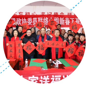
盐池县政协联合青山乡三级政协委员联络小组开展“翰墨飘香暖人心 大家送福进万家”新春下基层慰问困难群众慰问活动。