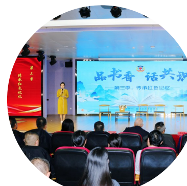
吴忠市政协委员、盐池县政协委员开展“品书香·话共识”第三季“传承红色记忆”主题读书活动。