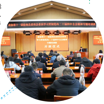
盐池县政协举办学习贯彻党的二十大精神专题培训班。