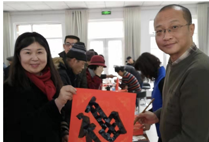
宋琰（右）在“我们的中国梦——文化进万家”活动中为群众赠“福”送暖。

宋琰，自治区政协常委，自治区文史研究馆副馆长、宁夏书法家协会主席。兼顾文艺工作者与政协委员双重身份，他既坚守文艺为民初心，以笔墨为桥扎根基层传递文化温情，也锚定民生发展大局，以精准建言助力民生改善，在文化传播与履职尽责的道路上步履不停、笃行不怠。