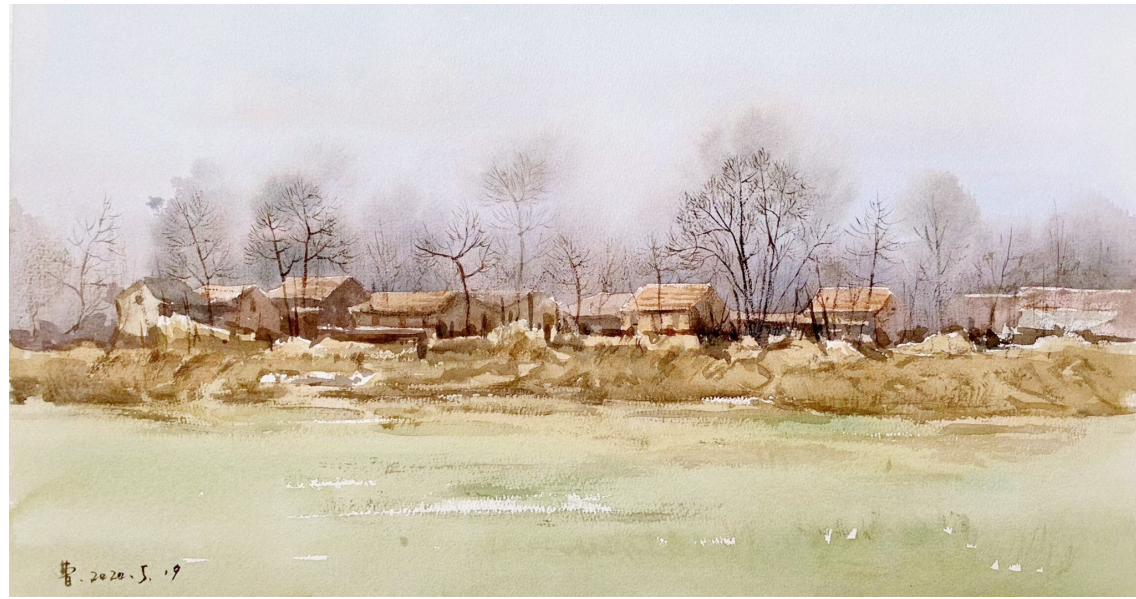
《寂静的村陌》(水彩画)