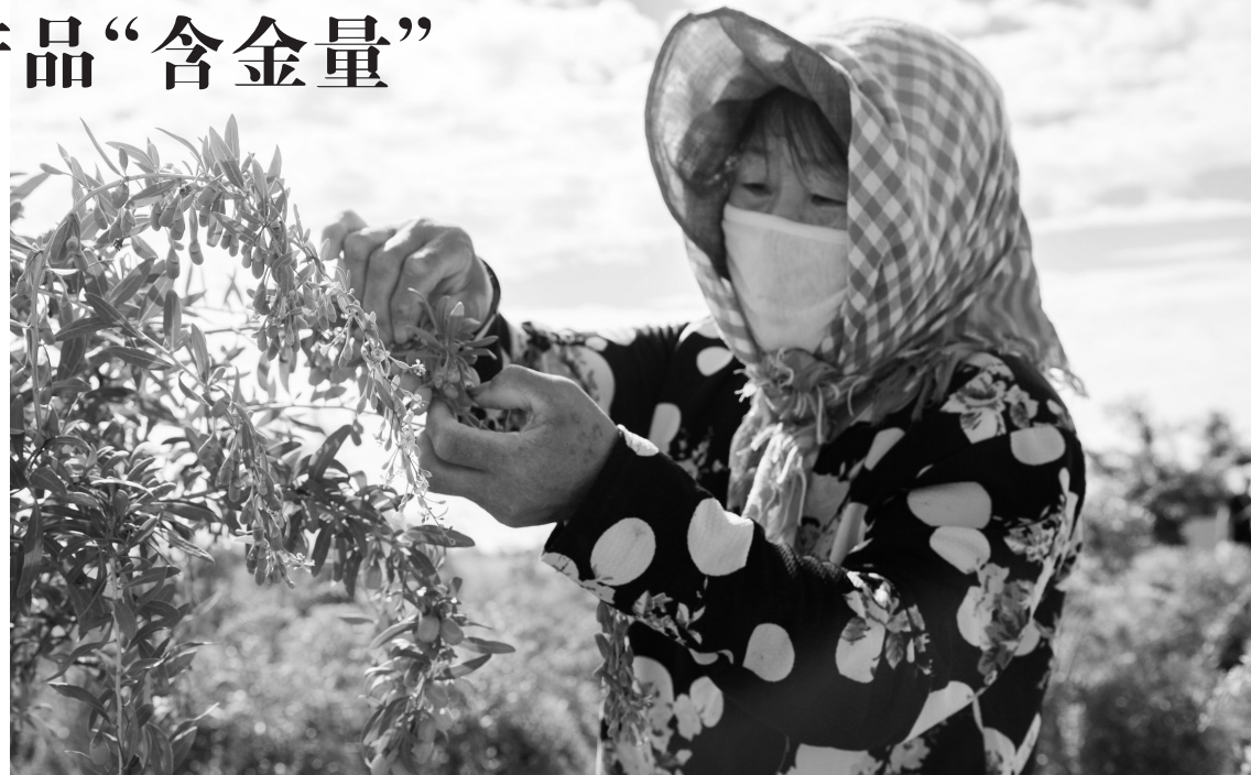
农户采收新鲜枸杞。

枸杞是宁夏的“地域符号”和“红色名片”,也是具有竞争优势和品牌优势的自治区特色主导产业。科技创新助推枸杞产品深度研发,让宁夏枸杞有了更多新形态,也迎来了新机遇。