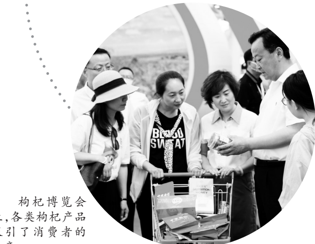
枸杞博览会上,各类枸杞产品吸引了消费者的注意。

要用好东西部合作机制,按照“协同创新、合作共赢”原则,加强与东部发达地区高校和科研院所的合作,加快枸杞新品种、新技术、新工艺、新产品研发及核心技术和优秀科技成果产业化,提升枸杞企业深加工能力。要加大对枸杞产业项目的支持力度,尤其是在枸杞深加工类项目上给予一定倾斜,支持引导枸杞加工企业加大研发投入,不断提升企业自身研发实力。以项目带动深加工环节的技术升级,进一步开发更多更好的枸杞深加工产品,推动枸杞深加工技术能力的提升。