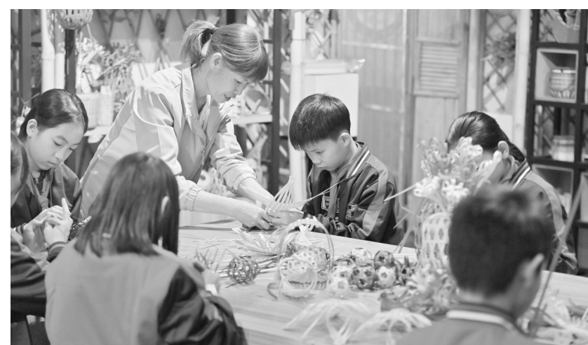
日前,在广西岑溪市南渡中心小学,老师在指导小学生练习竹芒编织技艺。近年来,广西岑溪市南渡中心小学将当地非遗项目——竹芒编织技艺引进课堂,打造特色校园文化,丰富学生课外生活。

长春市将持续开展“百所高校、百名博士”长春产业行系列活动,诚邀更多域内外高校、博士等紧缺人才与全市重点产业企业实现项目合作、成果转化、科研对接,全力助推长春全面振兴实现新突破。(据《工人日报》)