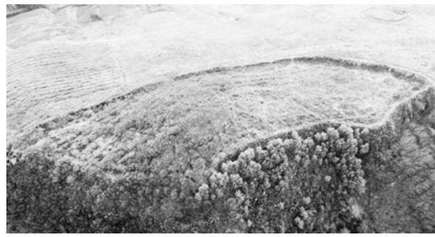
河南省平顶山市叶县境内的楚长城遗址。

冬日里，登上地处河南省平顶山市叶县的周王寨山举目四望，起伏的山峦间，一条“土龙”时隐时现，沿着山脊向远处绵延，伴着呼啸的山风，仍显出莽莽雄姿。