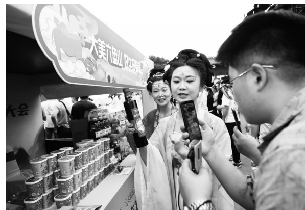
固原市相关部门线上推介特色农产品。