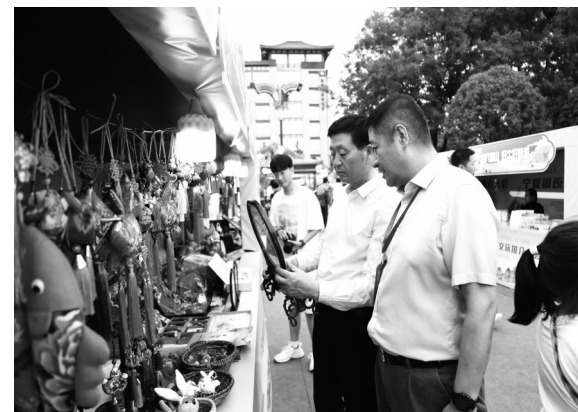
固原市特色文旅产品在西安市展出。