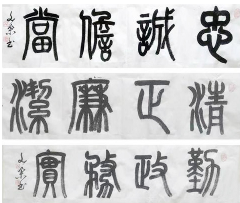
▲书法 牛文举 作(吴忠市政协老干部)