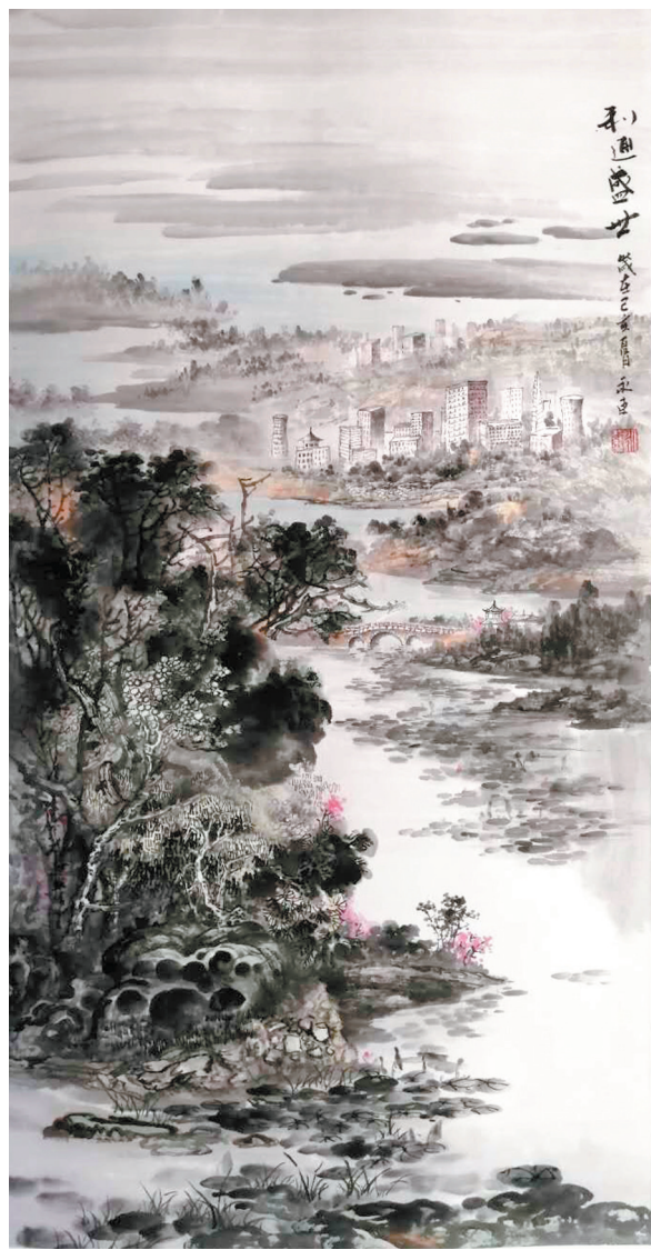
《利通盛世》曹永东作（民建宁夏区委会员）