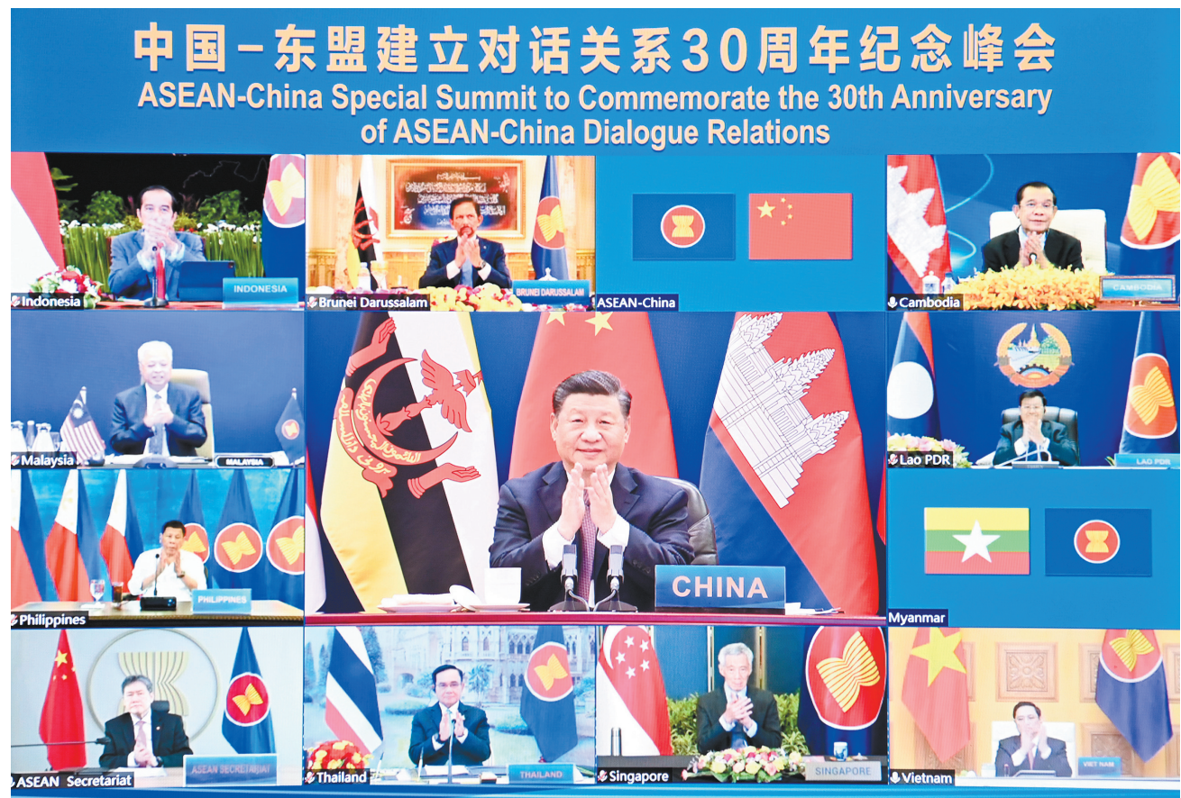
11月22日上午,国家主席习近平在北京以视频方式出席并主持中国-东盟建立对话关系30周年纪念峰会,发表题为《命运与共 共建家园》的重要讲话。中国东盟正式宣布建立中国东盟全面战略伙伴关系。

新华社北京11月22日电 国家主席习近平22日上午在北京以视频方式出席并主持中国-东盟建立对话关系30周年纪念峰会。中国东盟正式宣布建立中国东盟全面战略伙伴关系。 习近平发表题为《命运与共 共建家园》的重要讲话。 习近平指出,中国东盟建立对话关系30年来,走过了不平凡历程。这30年,是经济全球化深入发展、国际格局深刻演变的30年,是中国和东盟把握时代机遇、实现双方关系跨越式发展的30年。我们摆脱冷战阴霾,共同维护地区稳定。我们引领东亚经济一体化,促进共同发展繁荣,让20多亿民众过上了更好生活。我们走出一条睦邻友好、合作共赢的光明大道,迈向日益紧密的命运共同体,为推动人类进步事业作出了重要贡献。