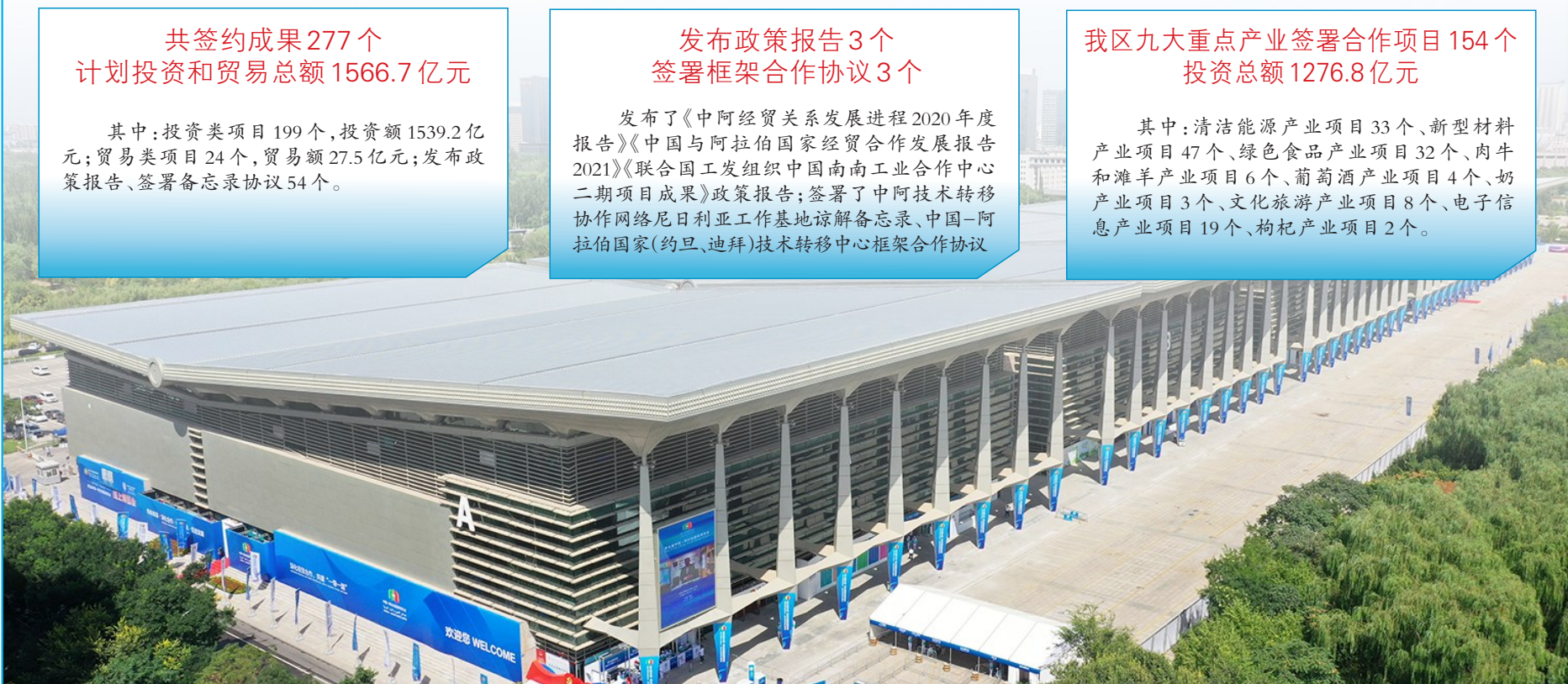
第五届中国-阿拉伯国家博览会在宁夏银川国际会展中心举办（无人机照片）。

其中：清洁能源产业项目 33 个、新型材料产业项目 47 个、绿色食品产业项目 32 个、肉牛和滩羊产业项目 6 个、葡萄酒产业项目 4 个、奶产业项目 3 个、文化旅游产业项目 8 个、电子信息产业项目 19 个、枸杞产业项目 2 个。